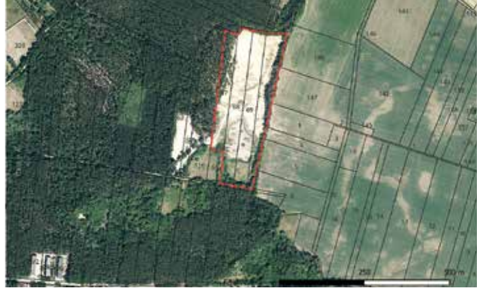
Projektgebiet 6,8 ha Arten umweltbezogener Informationen

Im Umweltbericht (UB) zum Entwurf sind die wesentlichen gesetzlichen Grundlagen aufgeführt. Auf der Basis der vorliegenden umweltbezoge-