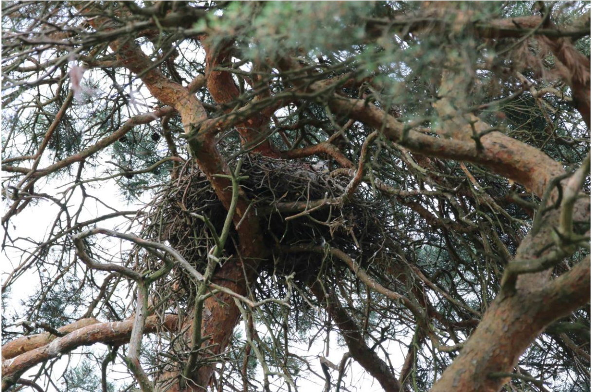
Abb. 5: Horst RM 2 (rechts auf dem Horst ist ein Jungvogel zu sehen)