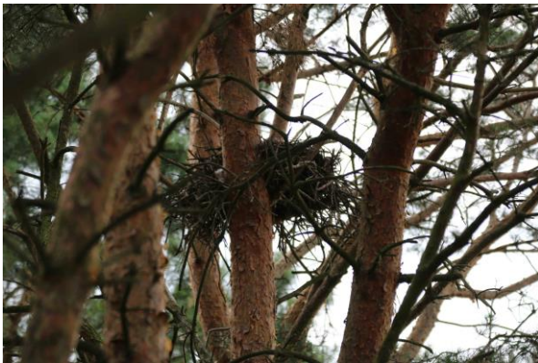
Abb. 3: Horst RM 1