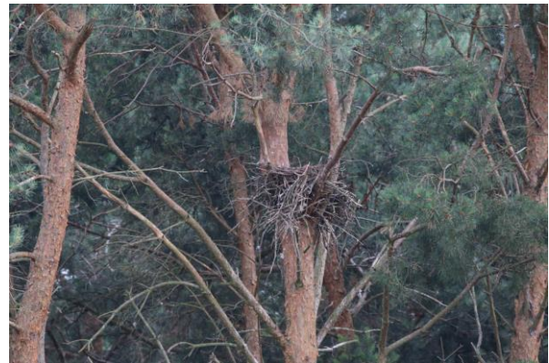
Abb. 4: Horst RM 3