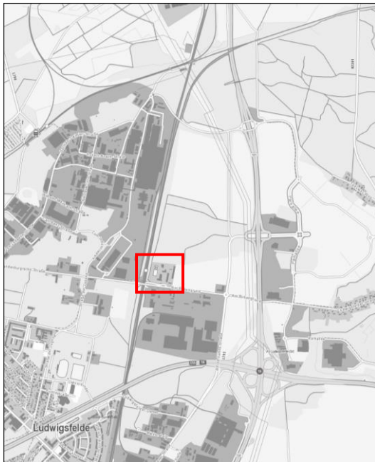
Lage im Stadtgebiet