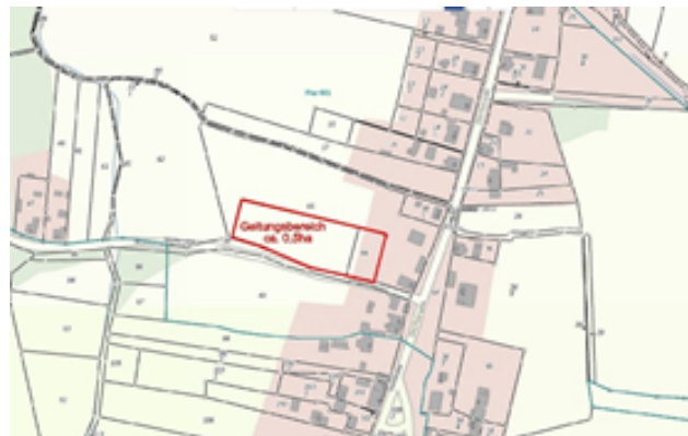
Übersichtsplan mit Darstellung Geltungsbereich (Lage rot umrandet, Darstellung nicht maßstäblich)

Zum Zeitpunkt der Verfahrenseinleitung beabsichtigte die Gemeinde Münchehofe die Planaufstellung bei Einbeziehung von Außenbereichsflächen, die in unmittelbarem Siedlungsanschluss liegen, im beschleunigten Verfahren nach §13b BauGB. Es erfolgte Aufstellungsbeschluss, das Beteiligungsverfahren sowie der Satzungsbeschluss am 27.05.2021. Die mit Schreiben des Amtes Schenkenländchen vom 04.08.2021 beantragte Genehmigung des B-Plans wurde nicht erteilt. Die Versagung der Genehmigung wurde mit Schreiben des Landkreises Dahme- Spreewald vom 01.11.2021 einschließlich Begründung mitgeteilt. Nunmehr ist beabsichtigt, den Plan durch Behebung der Mängel im ergänzenden Verfahren zu heilen.