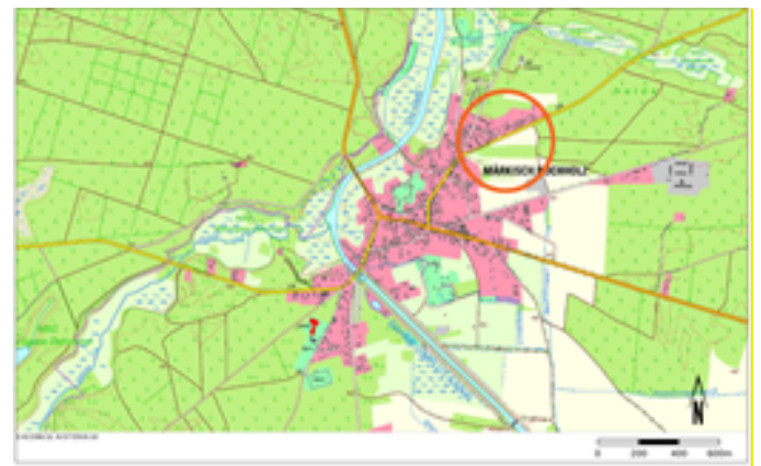
Abbildung 1: Lage des räumlichen Geltungsbereichs der Ergänzungssatzung im Stadtgebiet (Lage rot umrandet)

Die Lage und Abgrenzung des Plangebietes ist in den beigegeführten Kartenausschnitten dargestellt.