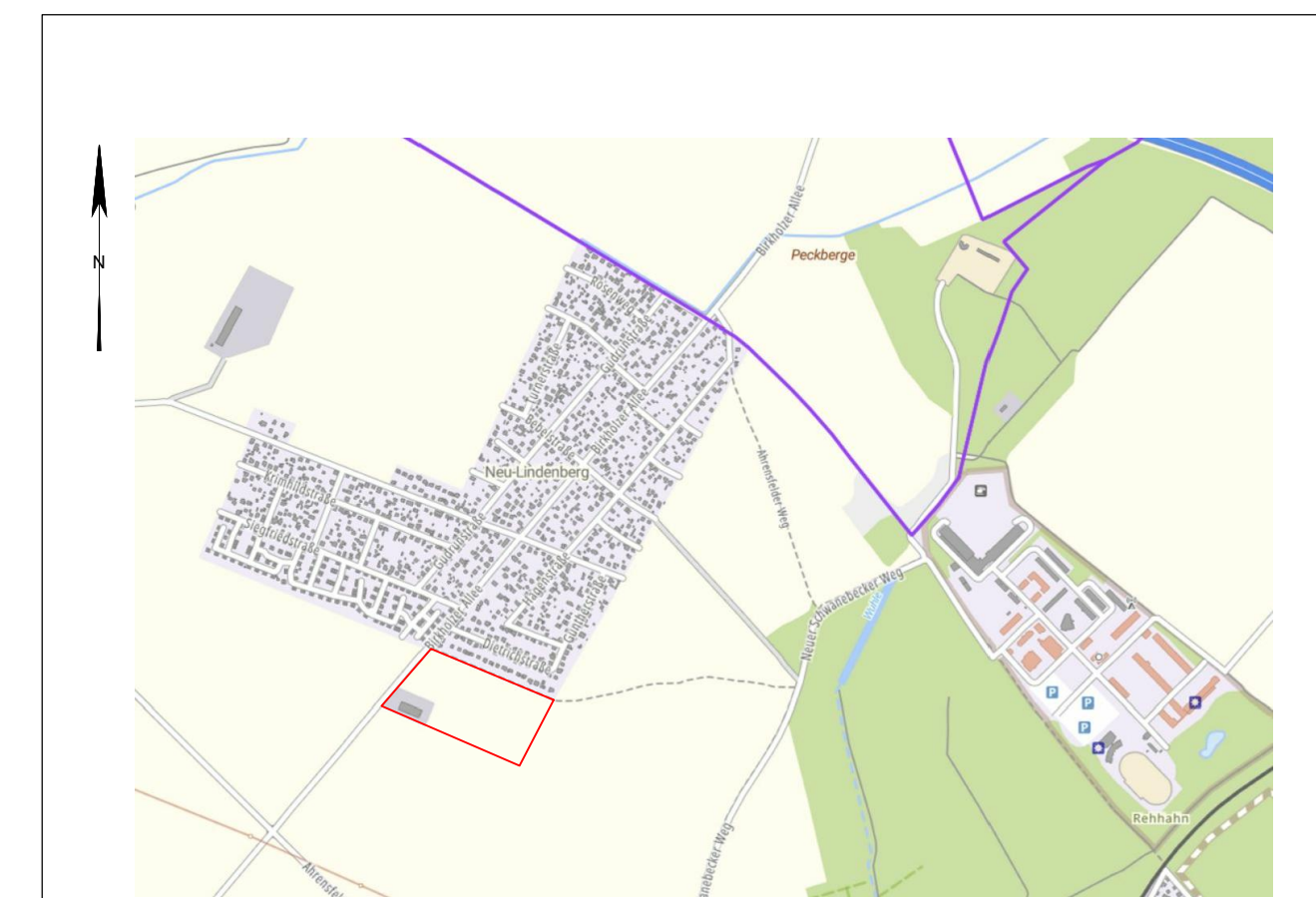
Übersichtskarte M 1 : 20.000