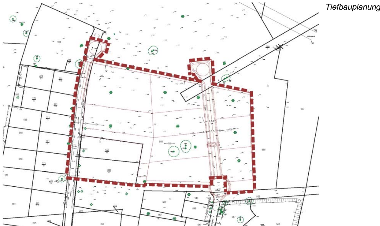
Abb. 4 Darstellung der Verkehrsplanung und des Parzellierungskonzeptes, eigene Karte

Alle sonstigen im rechtskräftigen B-Plan festgesetzten Verkehrsflächen werden nach einer vorliegenden Tiefbauplanung neugestaltet.