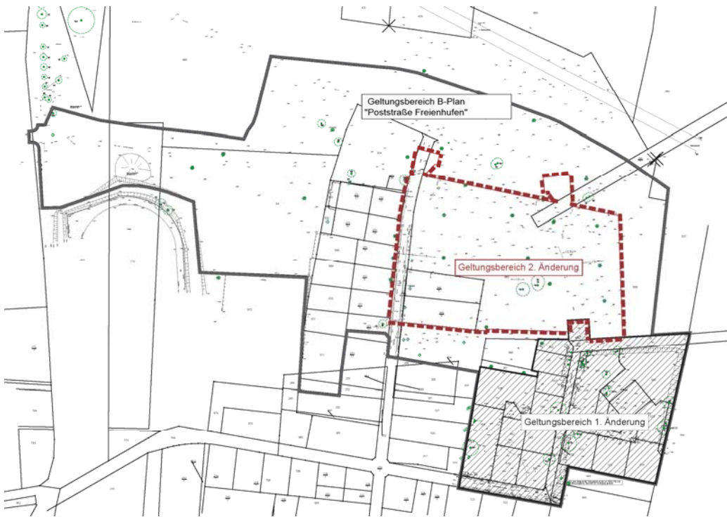
Abb. 1 Darstellung Übersicht der Geltungsbereiche, eigene Karte