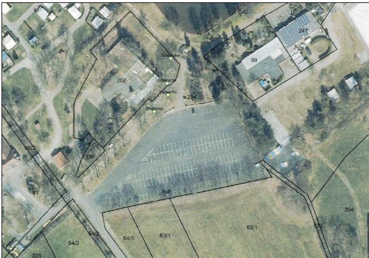
Abbildung 3: Lage der Naturdenkmale

Die vier Stieleichen werden in der Anlage 1 (zu § 1 Abs. 1) Naturdenkmalliste unter Punkt 4 Stadt Falkenberg, Identifikations-Nr. 41, 211, 212, und 213 geführt. Alle vier Bäume waren bei der Baumkontrolle in 2022 vor Ort mit dem Naturdenkmalschild gekennzeichnet.