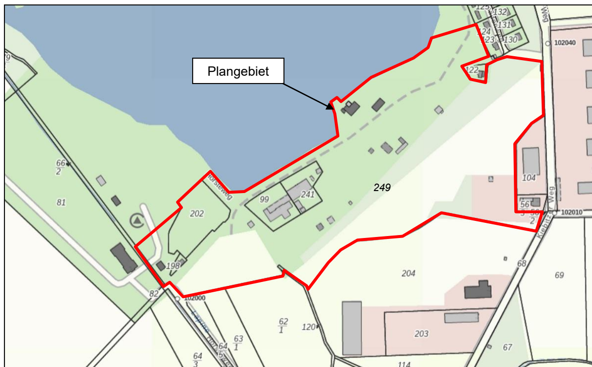
Abbildung 1: Lage des Plangebietes im Raum

Gemarkung: Falkenberg Flur: 13 Flurstücke: 241, 99, 202, 198, Teil aus 249 (alt 234) und 120 Größe: ca. 6,5 ha