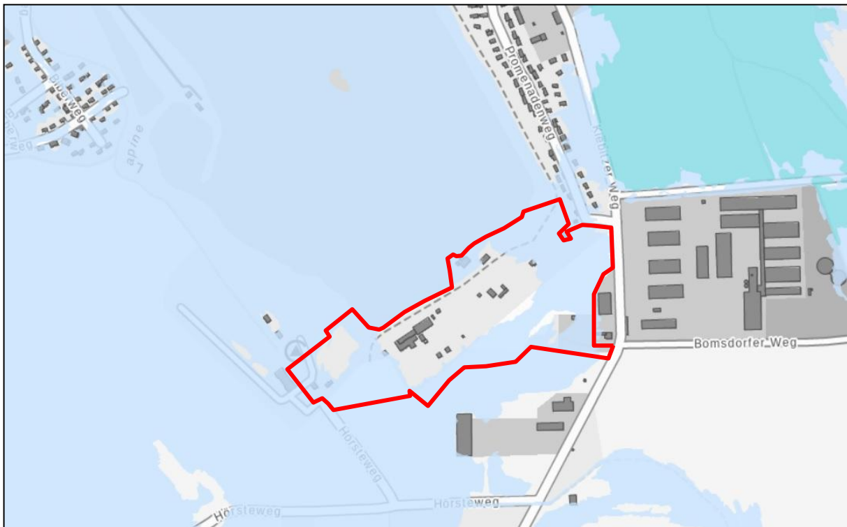
Abbildung 4: Lage des Plangebietes im Hochwasserrisikogebiet der Elbe

Quelle: https://apw.brandenburg.de/ (ohne Maßstab)