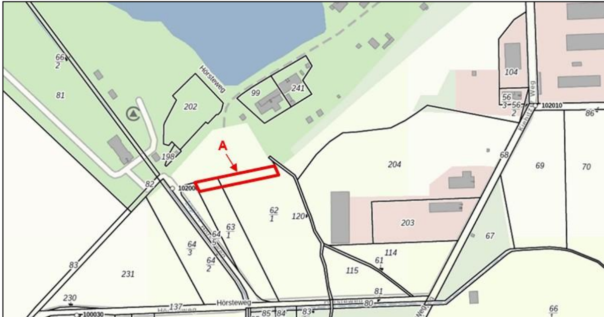
Abbildung 5: Lage der Ausgleichsmaßnahme A außerhalb des Plangebietes

Quelle: https://bb-viewer.geobasis-bb.de/ (ohne Maßstab)