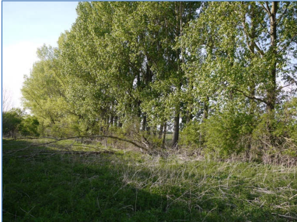
Abb. 11 Hecken und Windschutzstreifen: 071323 geschlossen, überwiegend nicht heimische Gehölze BHBN (überwiegend Hybridpappeln)