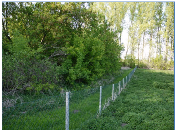
Abb. 14 Baumgruppen: 071532 einschichtige oder kleine Baumgruppen, nicht heimische Baumarten BEXF (überwiegend Eschenahorn, Abgrenzung zur Wohnbebauung)