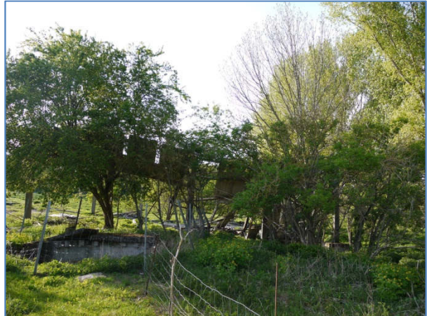
Abb. 12 071021 flächige Laubgebüsch überwiegend heimische Arten BLMH (Holunderaufwuchs in Gebäude-nähe)