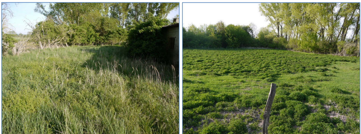
Abb. 9 und 10 051422 Staudenfluren und -säume frischer, nährstoffreicher Standorte verarmte oder ruderalisierte Ausprägung GSMA (Brennnessel dominierte Bereiche)