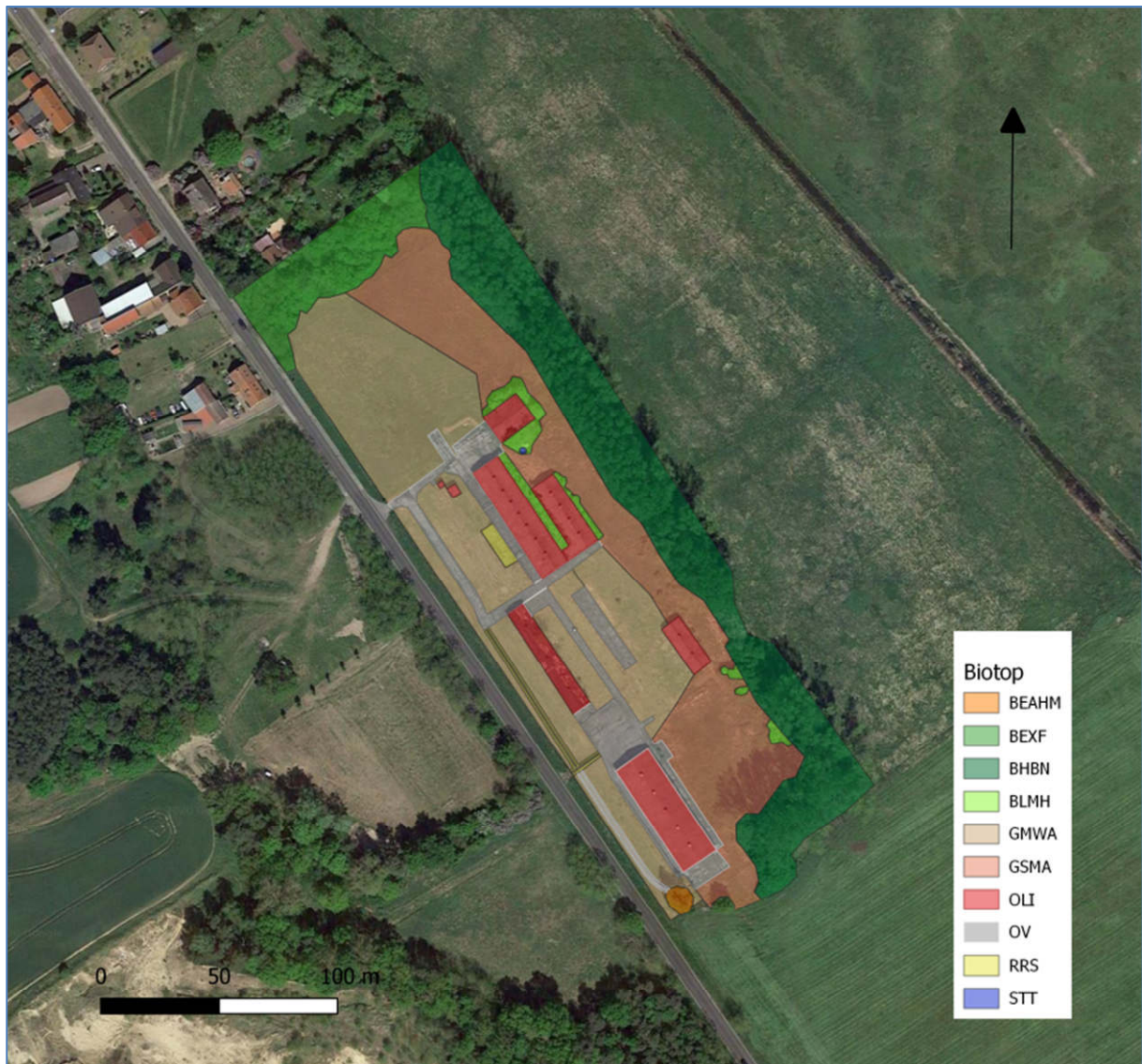
Abb. 3 Luftbild Untersuchungsgebiet vBP „PV-Anlage Vietznitz-Friesack“ der Gemeinde Wiesenaue mit Biototypen