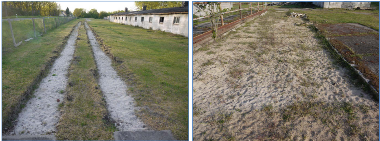
Abb. 5 und 6 Anthropogene Rohbodenstandorte und Ruderalfluren: 03110 vegetationsfreie und -arme Sandflächen RRS (Bereiche in denen Betonplatten aufgenommen wurden)