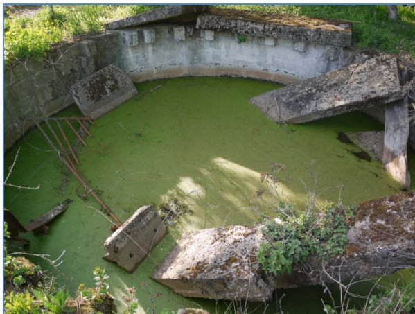
Abb. 4 Teich: 02153 überwiegend bis vollständig verbaut; bzw. technisches Becken STT (Betonbecken/ Sammelgrube)