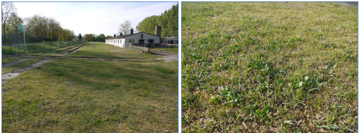
Abb. 7 und 8 Gras- und Staudenfluren: Frischwiesen und Frischweiden: 051112 artenarme Fettweide GMWA (intensive Beweidung)