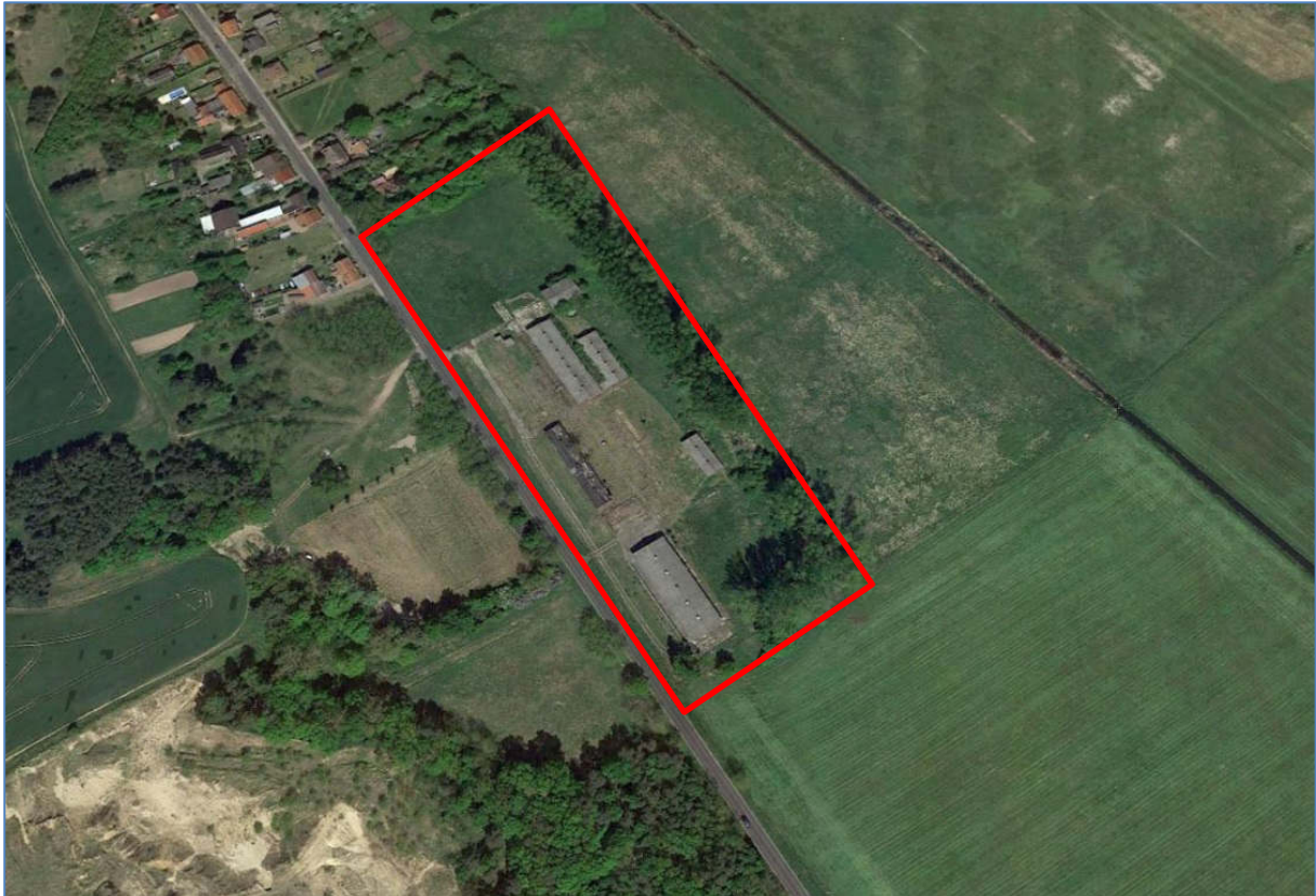
Abb. 2 Luftbild Untersuchungsgebiet vBP „PV-Anlage Vietznitz-Friesack“ der Gemeinde Wiesenaue