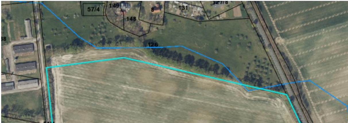
Abbildung 1 – Ausschnitt nördlicher Teil der Fläche A2 mit Gewässer L 150 Siebgraben

Im nördlichen Teil der Vorhabenfläche A2 kreuzt und verläuft der Siebgraben L150, welcher in die Unterhaltungspflicht des WBV Uckerseen fällt.