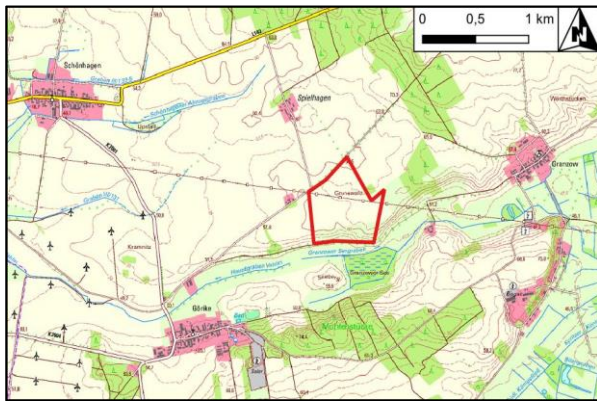
Abbildung 1 Lageabgrenzung zur 4. Änderung des FNP der Gemeinde Gumtow für den Ortsteil Görike auf Grundlage der Digitalen Topografischen Karte 1:25.000, unmaßstäblich