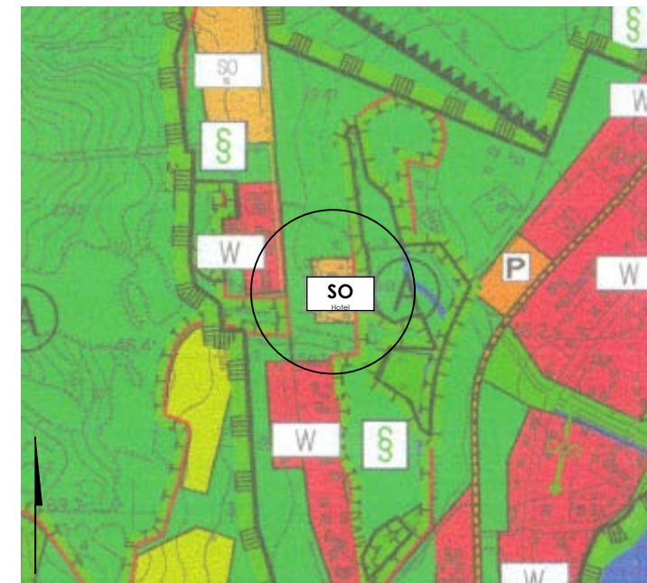
Flächennutzungsplan (Ausschnitt) in der Fassung 2006

Planzeichenverordnung (PlanzV) vom 18. Dezember 1990 (BGBl. 1991 I S. 58), die zuletzt durch Artikel 3 des Gesetzes vom 14. Juni 2021 (BGBl. 1 S. 1802) geändert worden ist