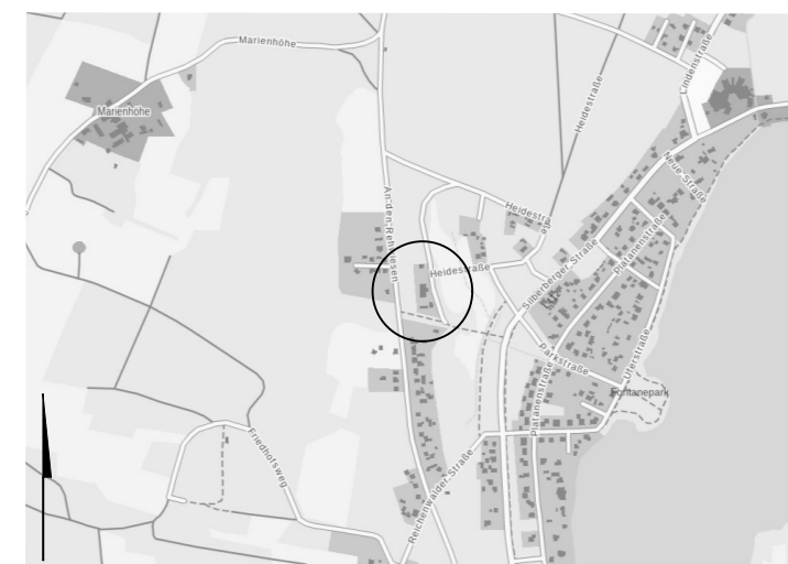
Übersichtskarte zum Flächennutzungsplan der Gemeinde Bad Saarow 29. Änderung

Maßstab 1:10.000