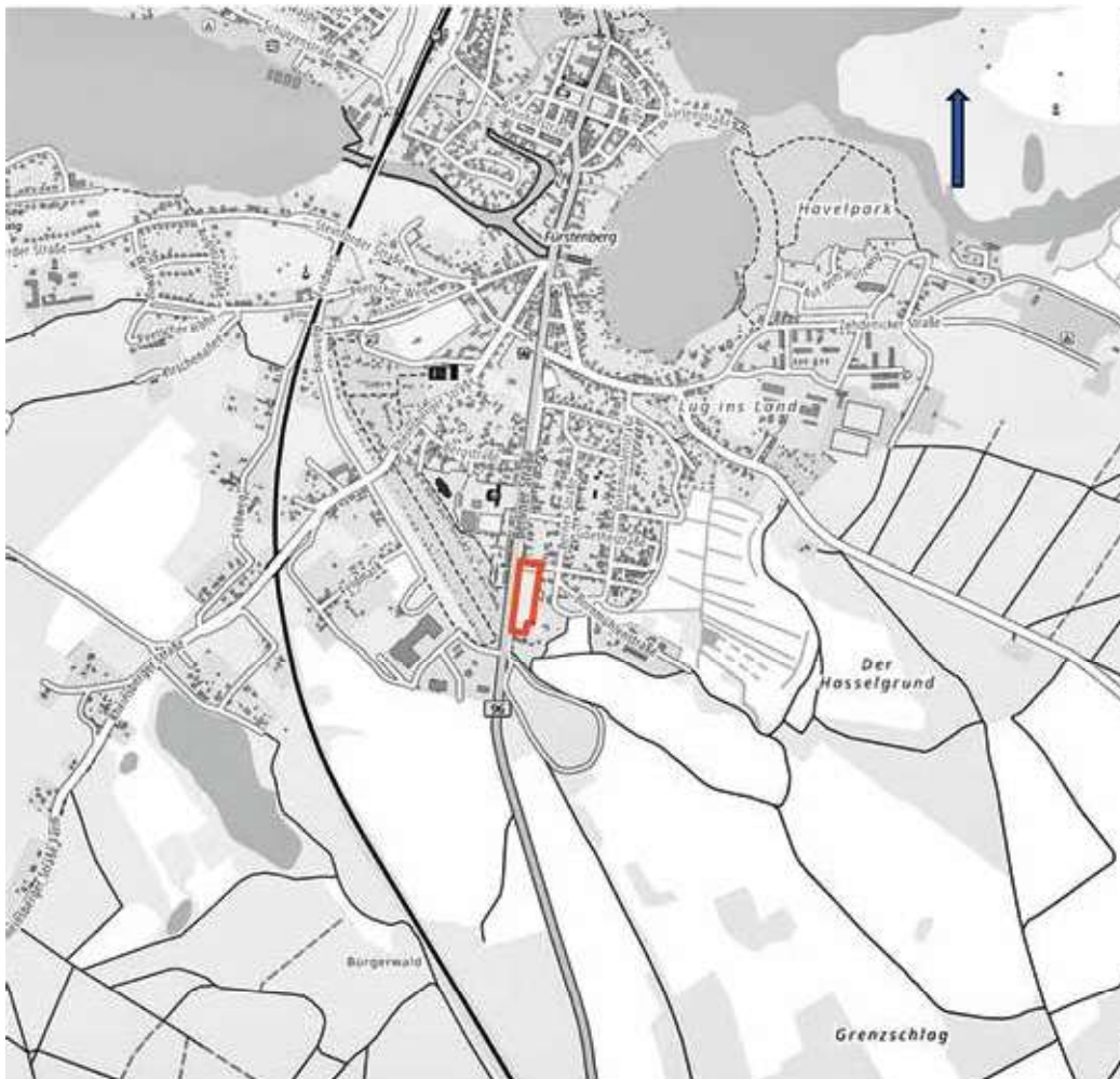
Übersichtsplan 1: Lage des Plangebietes, Maßstab: 1 : 10.000., genordet.