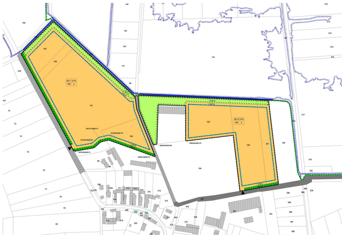
Abbildung 2: Auszug aus der Planzeichnung des vBP „Solarpark Merzdorf Nord“

Die gemäß § 3 Abs. 1 BauGB frühzeitige Unterrichtung der Öffentlichkeit und die frühzeitige Beteiligung der Träger öffentlicher Belange gemäß § 4 BauGB erfolgt in Form einer öffentlichen Auslegung.