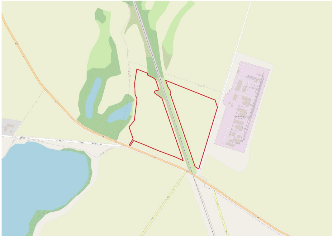
Abbildung 1: Lage der Vorhabenfläche (rot).

Der Geltungsbereich des Bebauungsplans befindet sich in der Gemeinde Zeschdorf in nordöstlicher Richtung circa 2,3 km vom Ortskern des Ortsteil Alt-Zeschdorf entfernt. Das Plangebiet grenzt südlich an die Bundesstraße B167. Gegenüber dieser Abgrenzung befinden sich Ackerflächen und das Gewässer „Aalkasten“. Die Nord- und West-Flanke des Vorhabengebiets schließen an landwirtschaftlich genutzte Flächen und an Wald an. In östlicher Richtung grenzt die Fläche an die „Schönfließler Straße“. Das Vorhabengebiet wird durch eine Bahntrasse in den Planteil „OST“ und den Planteil „WEST“ aufgeteilt.