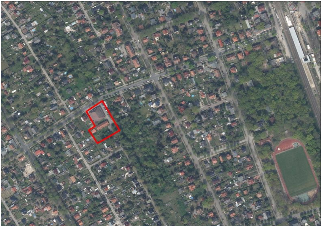
Orthophoto, Landesvermessung und Geobasisinformation Brandenburg (LGB); Bearbeitung PFE

Das Plangebiet befindet sich nordöstlich innerhalb der Gemeinde Schulzendorf und liegt unmittelbar an der Grenze zur Gemeinde Eichwalde. Das Plangebiet ist allseitig in eine gemeindeübergreifende Wohnsiedlung eingebettet. Das Wohngebiet zeichnet sich durch eine homogene Bebauungs- bzw. Siedlungsstruktur aus. Die Geschossigkeit beträgt überwiegend zwei Vollgeschosse.