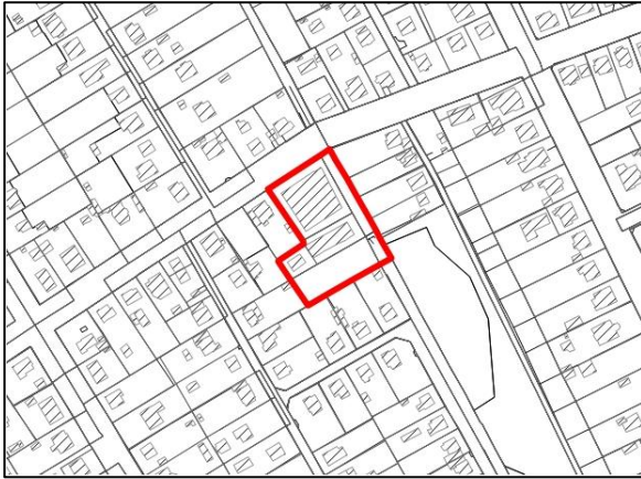
Abbildung 1: Lageplan B-Plan Nr. 20

ALKIS, Landesvermessung und Geobasisinformation Brandenburg (LGB); Bearbeitung PFE