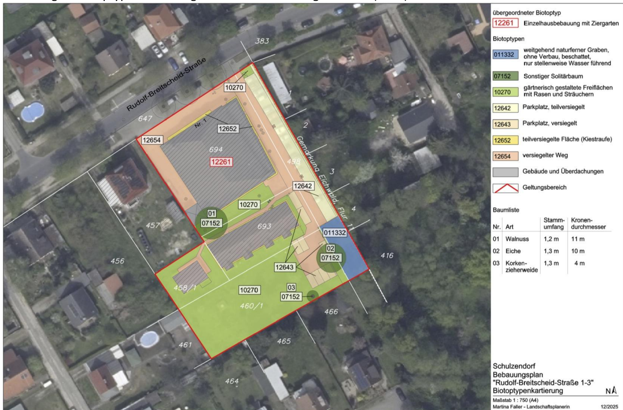
Abbildung 4: Biotoptypenkartierung innerhalb des Geltungsbereichs (2025)

Schutzgebiete sind von der vorliegenden Planung nicht betroffen. Geschützte Biotope wurden nicht festgestellt. Eine faunistische Untersuchung liegt derzeit nicht vor, wird aber nach Abschluss des Kartierzeitraums im September 2026 angefertigt.