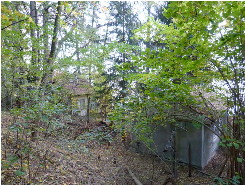
Bild 9: Östlich an das Plangebiet angrenzende desolante Ferienhausbebauung ohne derzeitige Nutzung