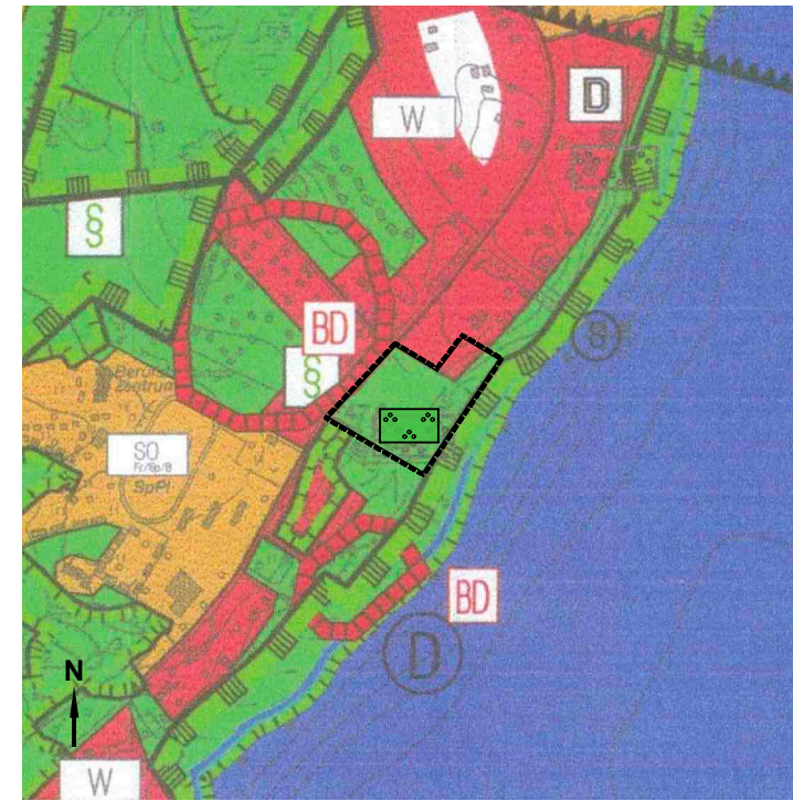
Flächennutzungsplan (Ausschnitt) in der Fassung 2006 mit Änderungsbereich © GeoBasis-DE/LGB, dl-de/by-2-0, 2006 Maßstab 1:10.000