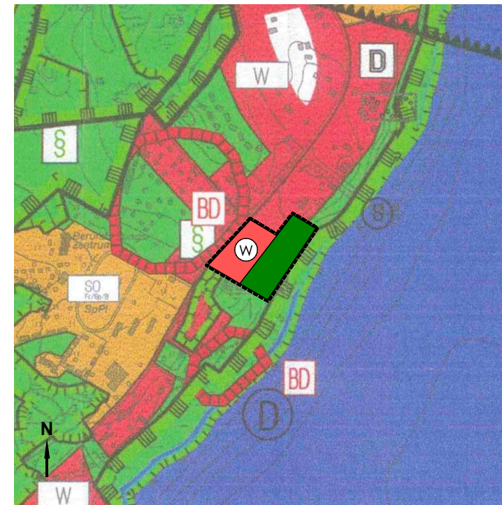
Flächennutzungsplan (Ausschnitt) in der Fassung 2006 mit Darstellung der Änderungen im Änderungsbereich Maßstab 1:10.000