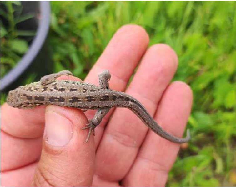
Foto 19 Zauneidechse, männlich, 02.06.2025