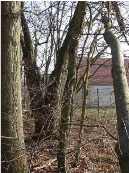
Abbildung 24: Ahorn (ID 12)