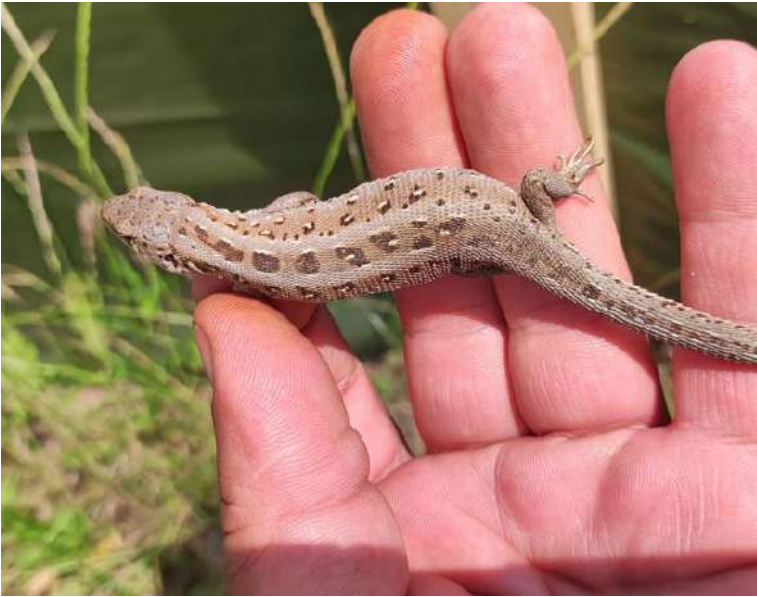
Foto 28 Zauneidechse, weiblich, 11.06.2025