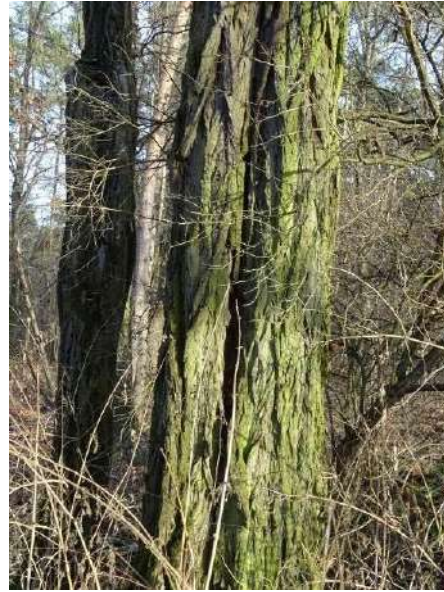
Abbildung 23: Robinie (ID 11), abstehende Rinde am unteren Stamm