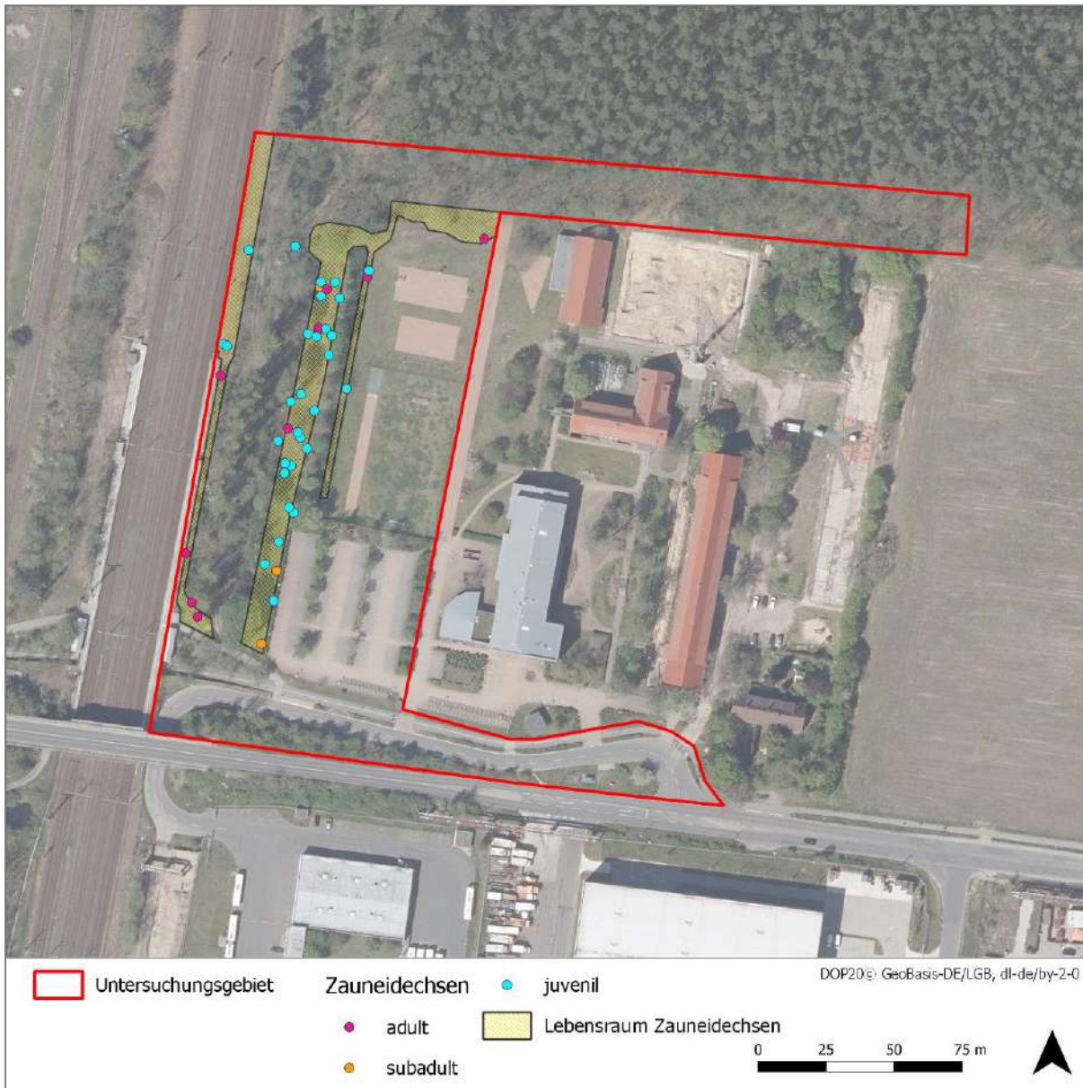
Abbildung 3: Fundpunkte Zauneidechsen im UG

Insgesamt wurden 43 Nachweise der Zauneidechse erbracht. Dabei handelte es sich um 4 weibliche und 3 männliche Tiere, 3 nicht näher bestimmte adulte Zauneidechsen, 3 subadulte Tiere sowie 30 juvenile Tiere. Die Nachweispunkte sind in Abbildung 3 dargestellt. Es wurde ein Gesamtlebensraum von rd. 3000 m 2 abgegrenzt. Der Lebensraum der Zauneidechse im UG setzte sich aus zwei Teilflächen zusammen. Der größere Teil mit den meisten Nachweisen lag auf dem Gelände des Oberstufenzentrums (rd. 2180 m 2 ). Der kleinere Teil umfasst die Bahnböschung im Nordwesten sowie einen schmalen Streifen entlang des Bahnsteigs (rd. 890 m 2 ). Nachfolgend werden die Lebensräume kurz beschrieben.