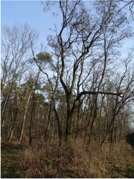
Abbildung 22: Robinie (ID 11)