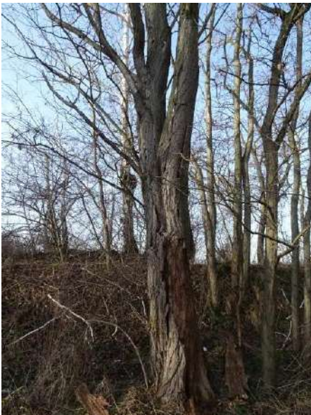
Abbildung 20: Robinie (ID 10)