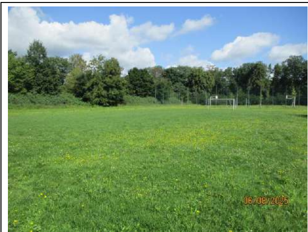
Abb. 3: Blick auf die Spiel- und Sportfläche und die westlich angrenzenden Heckenstrukturen