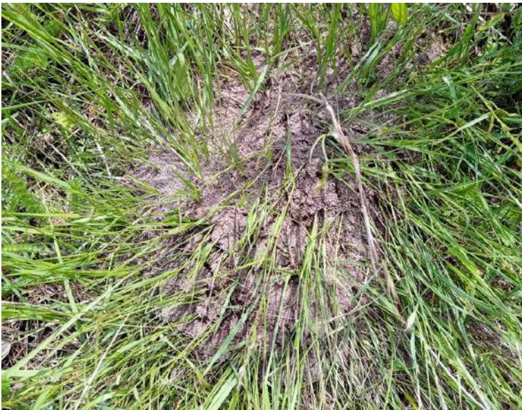
Foto 17 Ameisenbau, 26.05.2025