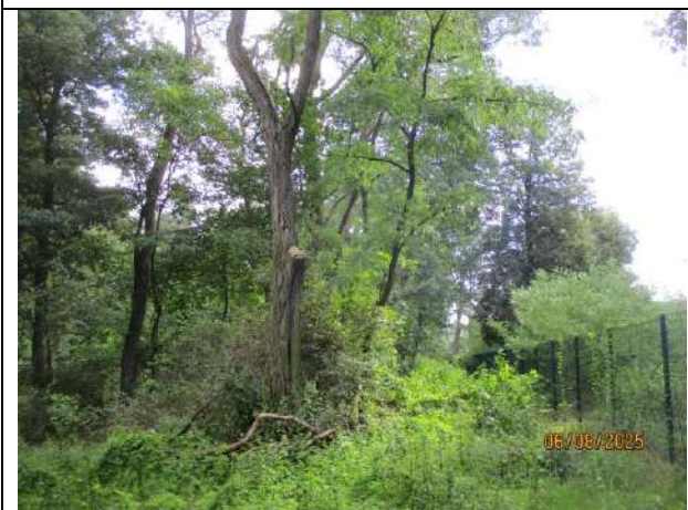
Abb. 7 Robinien- und Laubwald im nördlichen Bereich des Plangebietes