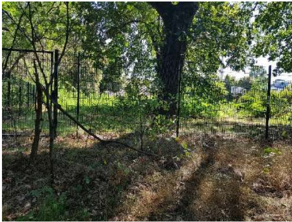
Abbildung 6: Bereich mit Altgras und Laub nordwestlich der Brachfläche