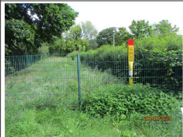
Abb. 5: Gras- und Staudenfluren zwischen der Hecke der Spiel- und Sportfläche und dem westlich angrenzenden Vorwald