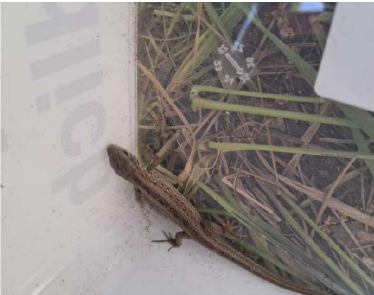
Foto 8 Zauneidechse, subadult, 21.05.2025