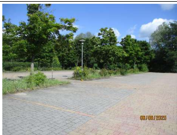
Abb. 1: Blick auf den Parkplatz

Der zentrale Bereich des Plangebietes wird im Wesentlichen durch einen befestigten Parkplatz mit regelmäßigem Baumbestand geprägt. Nördlich des Parkplatzes schließen Heckenstrukturen an, die das Sport- und Spielfeld des Oberstufenzentrums im Süden und Westen umfassen. Westlich des Parkplatzes schließen Gras- und Staudenfluren an, die dann in Vorwald bis zum angrenzenden Bahngelände übergehen. Der nördliche und nordwestliche Randbereich des Plangebietes wird geprägt durch Robinien- und Laubholzwald. Der südliche Planbereich besteht im Wesentlichen durch Straßen- und Verkehrsflächen.