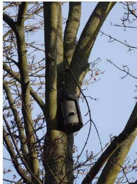
Abbildung 17: Fledermaus-Kasten an Ahorn (ID 4)