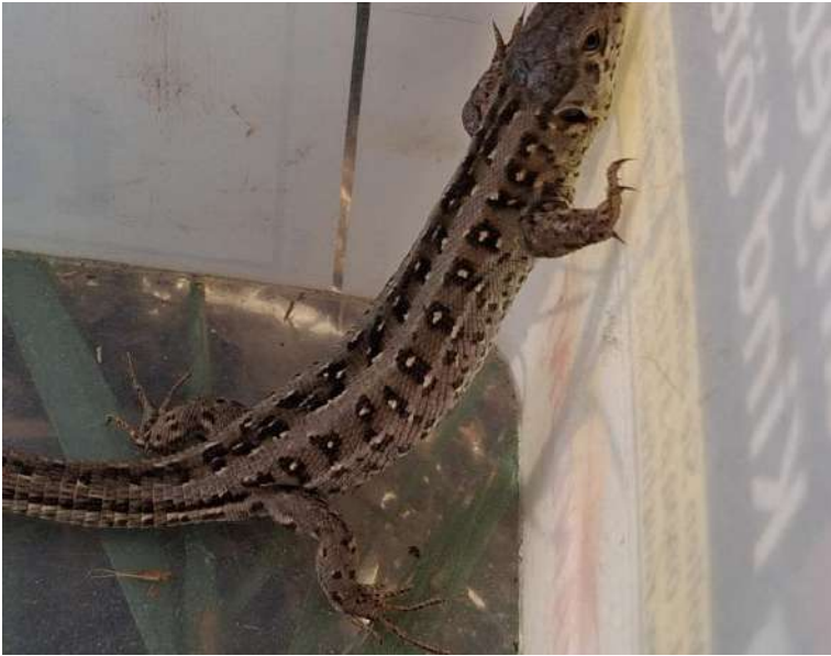
Foto 10 Zauneidechse, weiblich, 21.05.2025