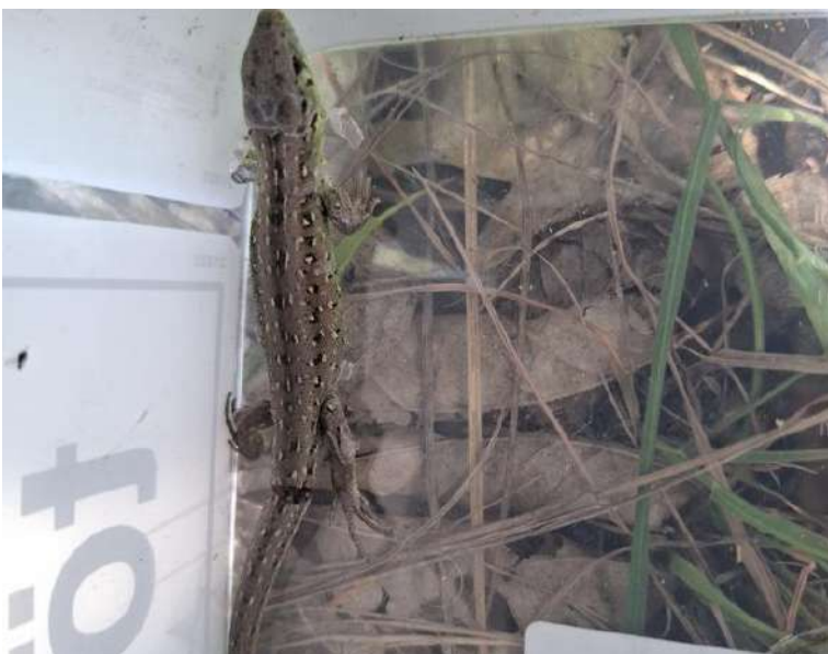
Foto 12 Zauneidechse, subadult, 21.05.2025