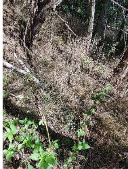
Abbildung 7: Hang mit Nachweis (juvenile Zauneidechse) nordwestlich des Grünstreifens