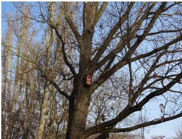
Abbildung 16: Nistkasten an Eiche (ID 2)