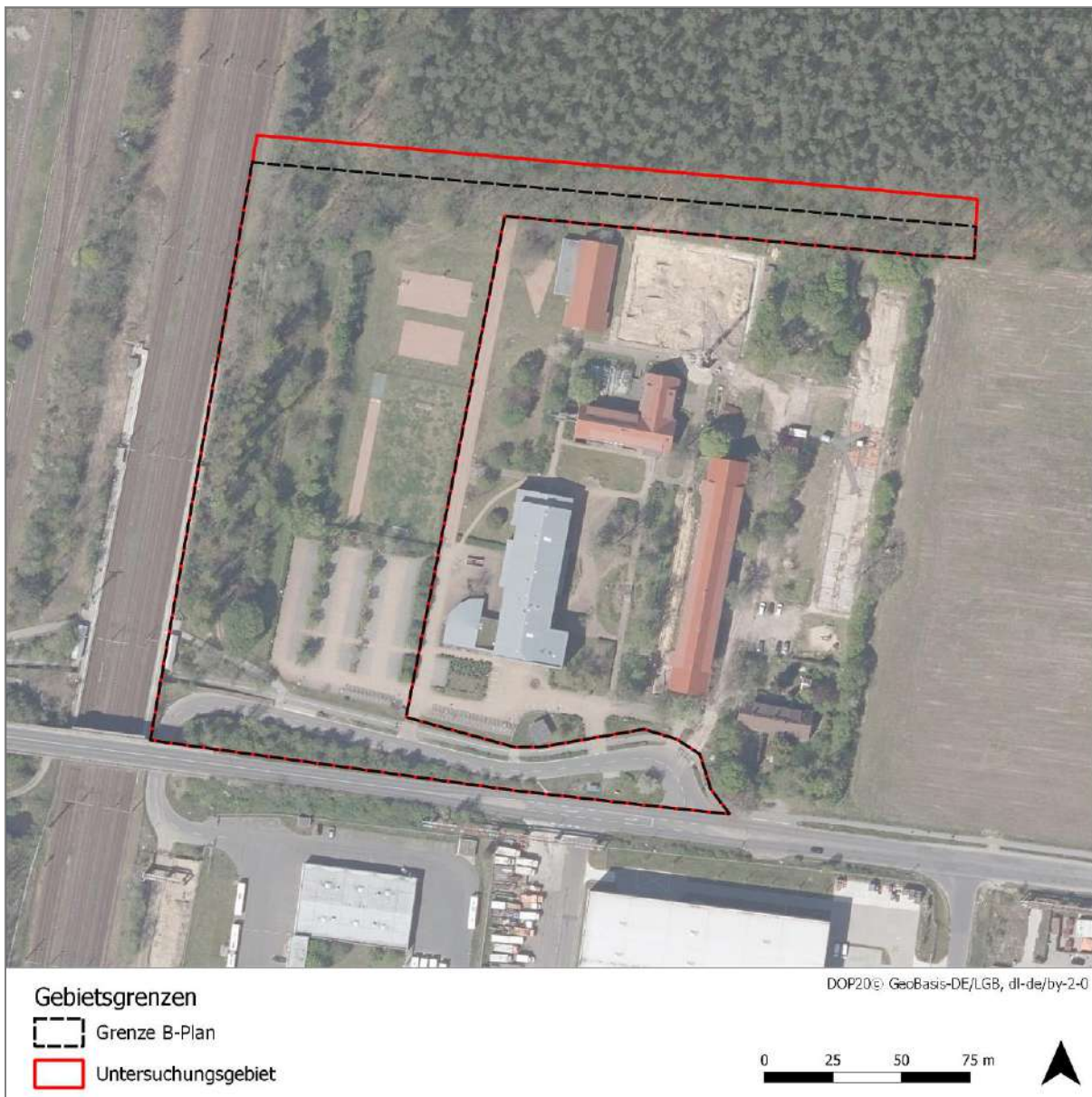
Abbildung 1: Grenze des B-Plans und Lage des Untersuchungsgebietes

Das Untersuchungsgebiet (UG) für die Kartierungen beinhaltet das Areal des Geltungsbereichs des B-Plans zzgl. eines Puffers von 10 m am nördlichen Rand (Abbildung 1). Das UG wird im Westen durch die Bahnstrecke Berlin-Halle (Anhalter Bahn) begrenzt. Die dazugehörige Bahnböschung und Abschnitte des Bahnsteiges liegen dabei noch im UG. Der zentrale Bereich gliedert sich in zwei Teile. An die Bahnanlagen schließt sich ein ca. 25 m breiter Gehölzstreifen an, der durch kleine Lichtungen und einen unbefestigten Weg gegliedert ist. Die Bäume sind überwiegend junge bis mittelalte Laubbäume sowie kleine Gruppen aus Kiefern. An den Gehölzstreifen grenzen im Osten Flächen des Oberstufenzentrums Teltow-Fläming an. Während die Gebäude des Oberstufenzentrums außerhalb des UGs liegen, befinden sich Parkplätze, Sportanlagen und Grünflächen innerhalb des UGs. Im Norden verläuft ein schmaler Streifen mit Laubbäumen unterschiedlichen Alters von der Bahn zu einer Brachfläche. Im Süden sind ein Abzweig der Straße „Am Birkengrund“ sowie das Straßenbegleitgrün Teil des UGs.