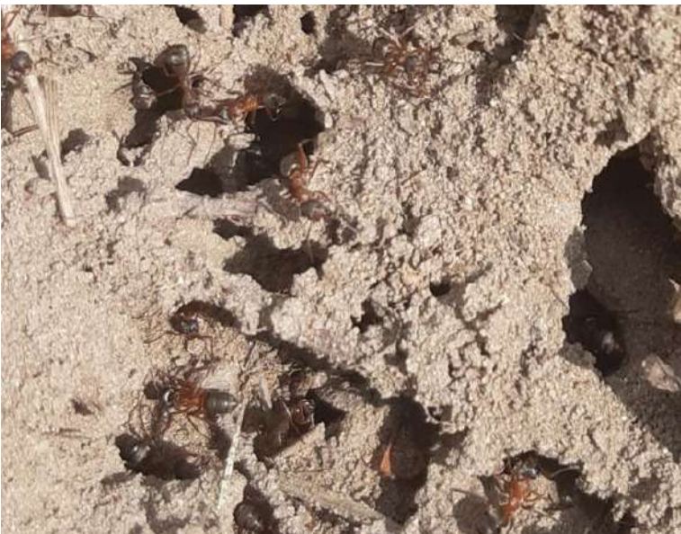
Foto 30 Ameisenbau, 11.06.2025