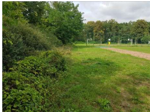
Abbildung 5: gehölzbestandener Wall mit Saumbereich, Ostseite (Blick nach Norden)