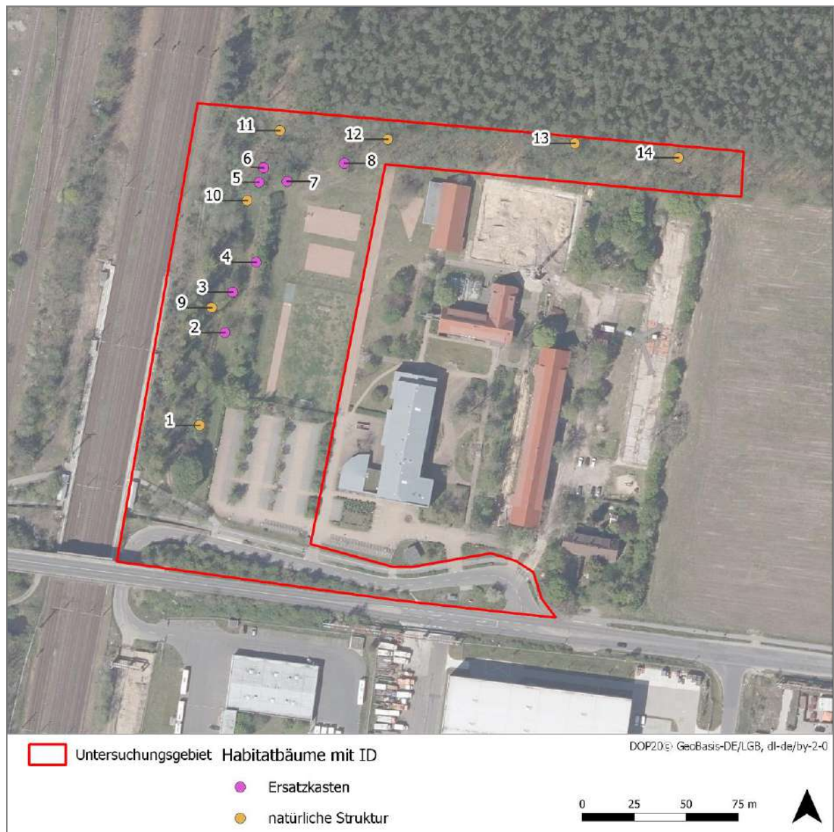
Abbildung 12: Habitatbäume (mit ID)

Avi: Potential für Höhlenbrüter; FM: Potential für Fledermäuse; GQ: Potential als Ganzjahresquartier von Fledermäusen; SQ: Potential als Sommerquartier von Fledermäusen