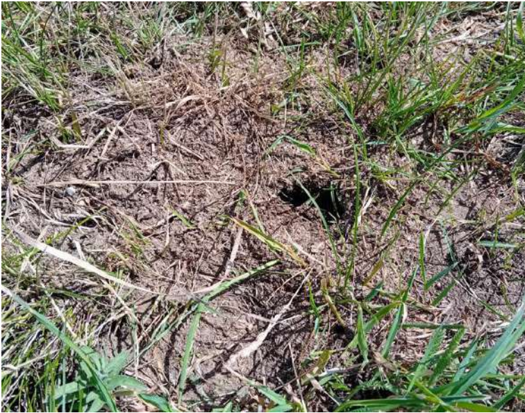
Foto 16 Ameisenbau, 26.05.2025