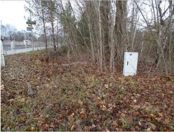
Abbildung 9: Ruderalflur am Bahnsteigzugang

außerdem das Zuwachsen und die damit einhergehende Verschattung der Lebensräume verhindert.