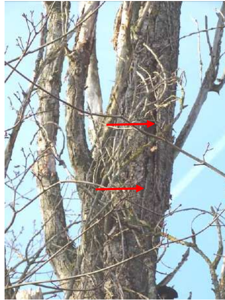
Abbildung 15: Pappel (ID 1), abstehende Rinde