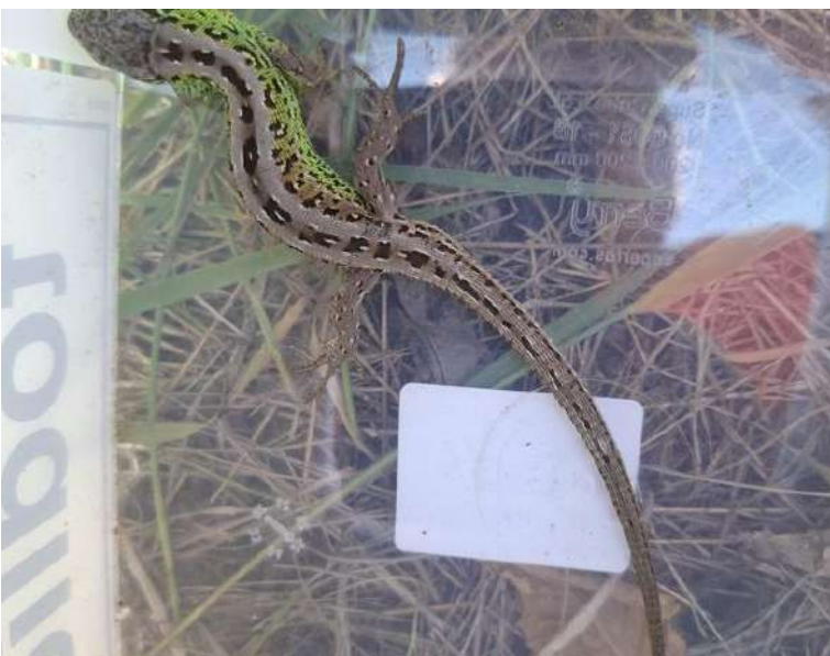
Foto 9 Zauneidechse, männlich, 21.05.2025