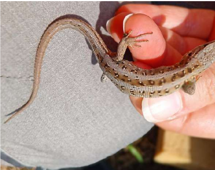
Foto 35 Zauneidechse, weiblich, 18.06.2025