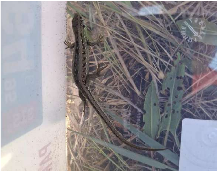
Foto 11 Zauneidechse, subadult, 21.05.2025