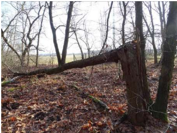
Abbildung 28: toter Baum (ID 14), auf 1,5 m abgebrochen