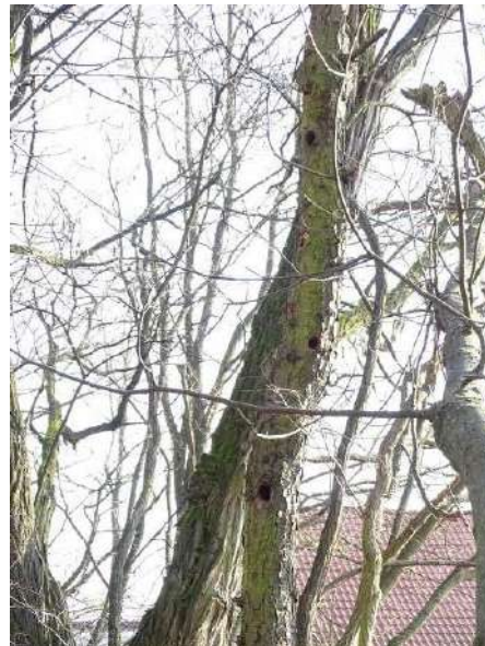
Abbildung 25: Ahorn (ID 12), 3 Spechtlöcher