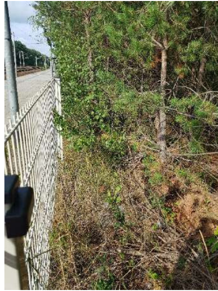
Abbildung 10: Saumbereich neben dem Bahnsteig