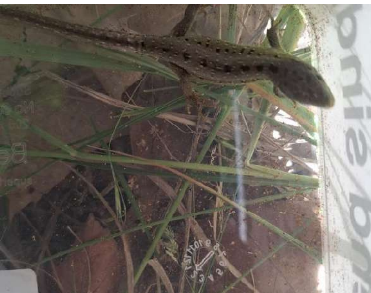
Foto 6 Zauneidechse, subadult, 21.05.2025