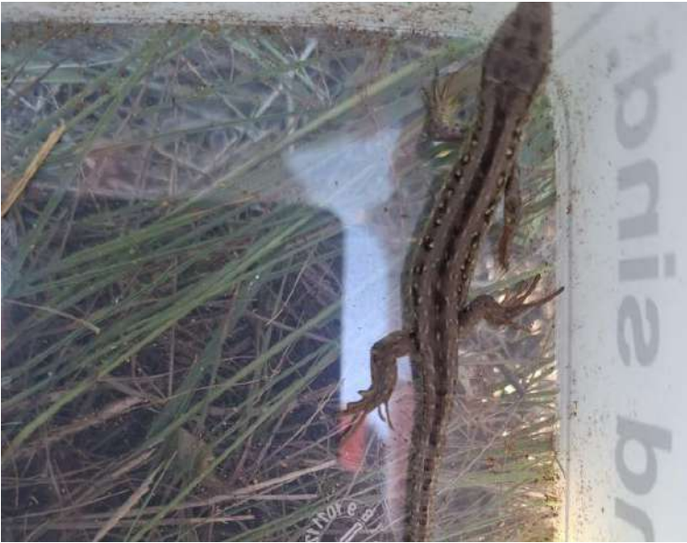
Foto 7 Zauneidechse, subadult, 21.05.2025