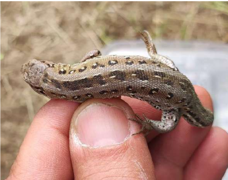
Foto 29 Zauneidechse, weiblich, 11.06.2025