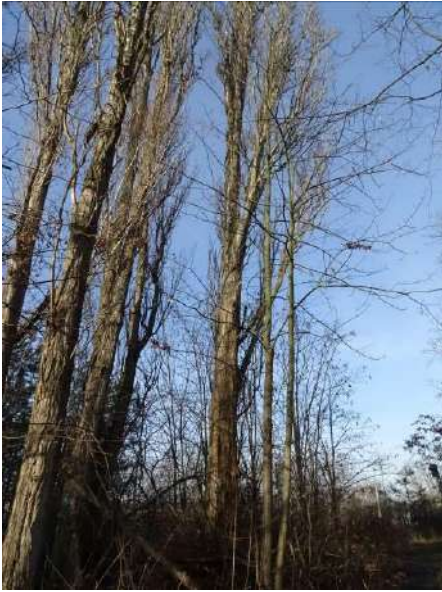
Abbildung 18: Pappel (ID 9)