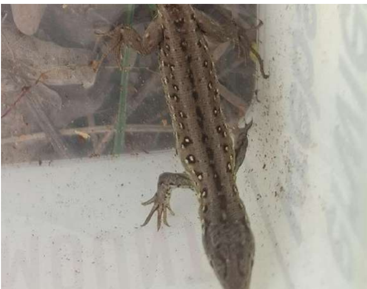
Foto 3 Zauneidechse, subadult, 21.05.2025