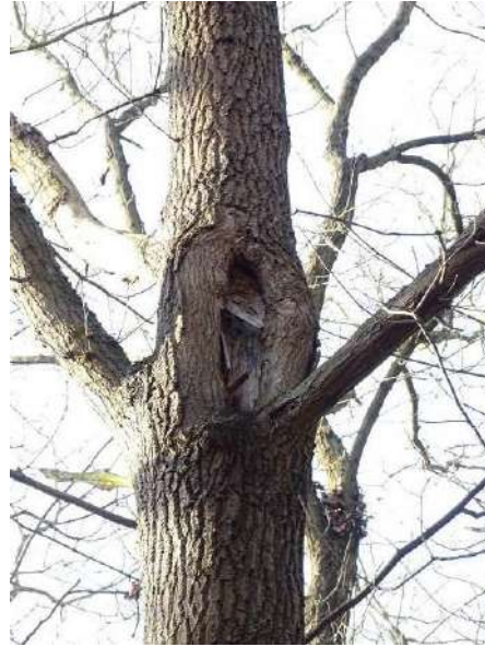
Abbildung 27: Eiche (ID 13), Astaufriss