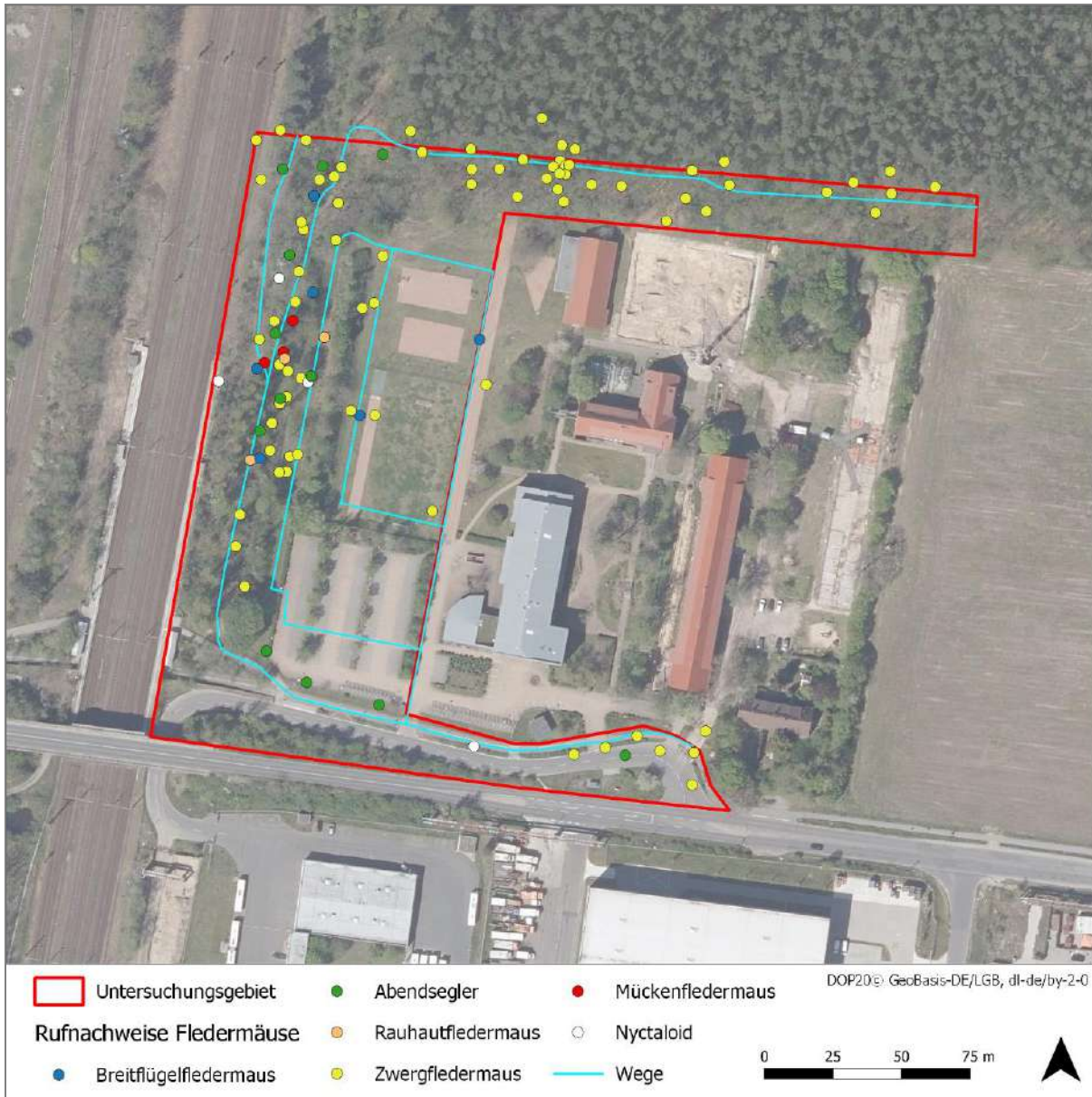
Abbildung 13: Nachweise der Fledermäuse

Die Aktivitätszahlen deuten darauf hin, dass das UG für die lokale Fledermausfauna vor allem eine Bedeutung als Jagdlebensraum aufweist. Dies trifft insbesondere für die Zwergfledermaus zu. Im Rahmen der Untersuchung konnten jedoch keine Hinweise auf Wochenstubenquartiere der Art in der unmittelbaren Nähe (etwa Gebäude des Oberstufenzentrums) des UGs gefunden werden.