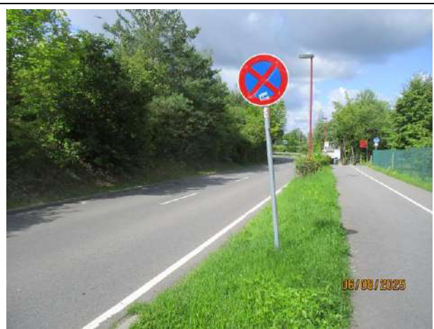
Abb. 4: Verkehrsflächen südlich des Parkplatzes