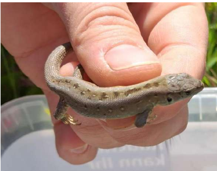
Foto 18 Zauneidechse, subadult, 26.05.2025