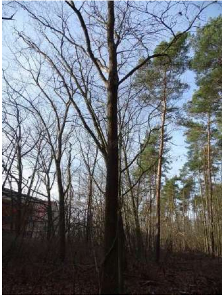
Abbildung 26: Eiche (ID 13)