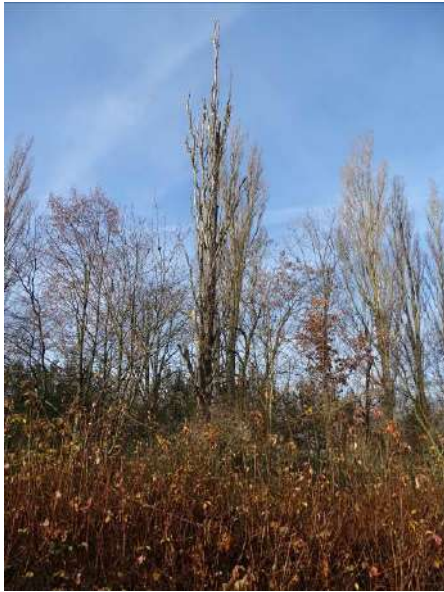
Abbildung 14: Pappel (ID 1)