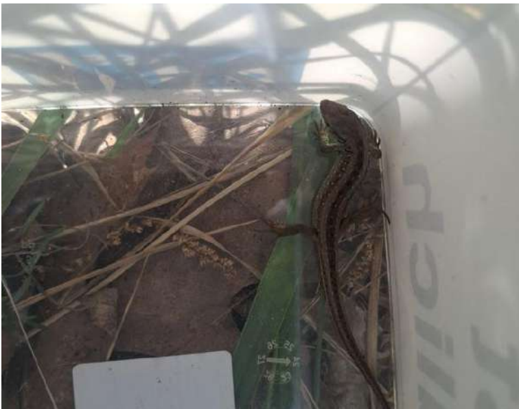
Foto 2 Zauneidechse, subadult, 21.05.2025