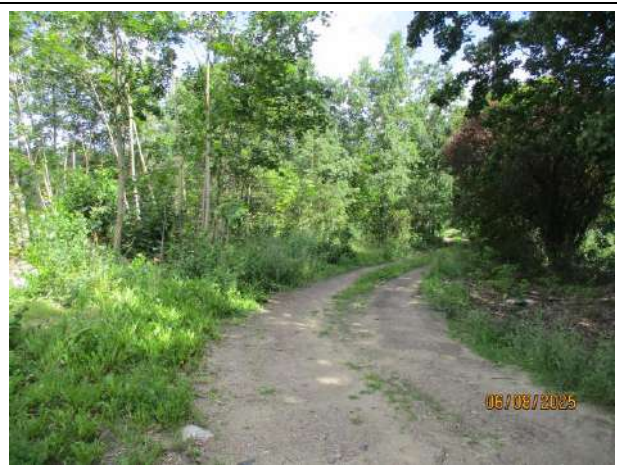
Abb. 6 Vorwald hinter der Gras- und Staudenflur und dem westlich angrenzenden Bahngelände