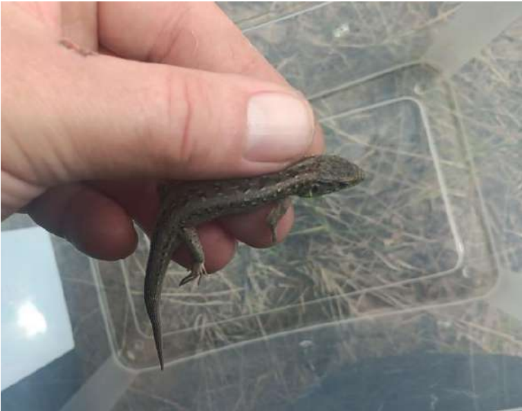
Foto 34 Zauneidechse, subadult, 16.06.2025