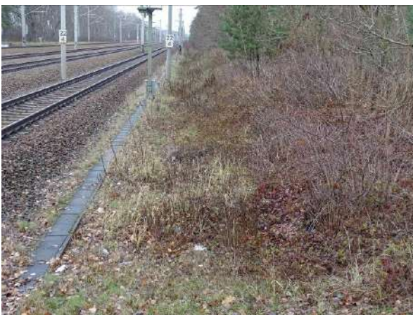
Abbildung 11: Bahnböschung (Blick nach Norden)