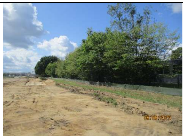
Abb. 8 abgeschobene Baurasse im östlicher Teilbereich des Plangebietes