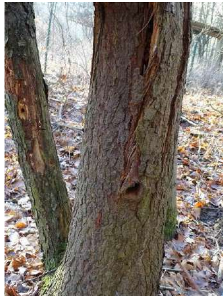
Abbildung 29: toter Baum (ID 14), Astloch unter dem Stammabbruch