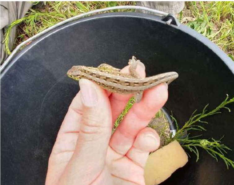
Foto 20 Zauneidechse, männlich, 02.06.2025