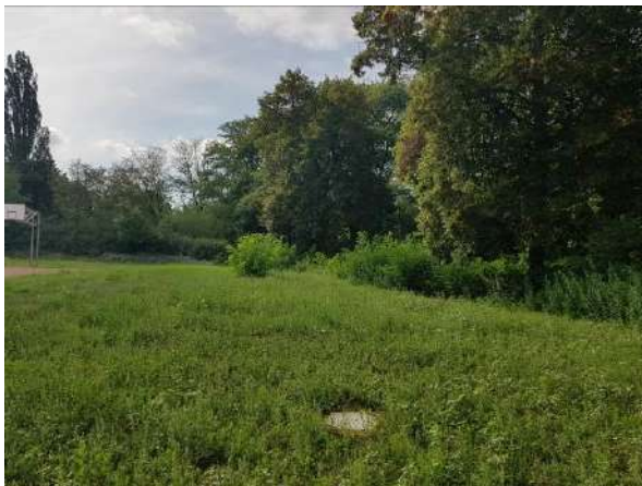
Abbildung 8: Saumbereich nördlich des Basketballplatzes