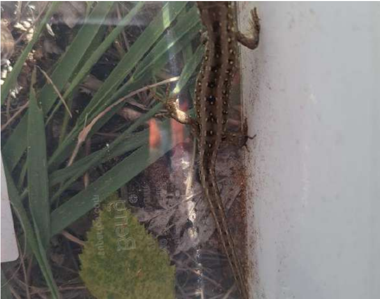
Foto 4 Zauneidechse, subadult, 21.05.2025