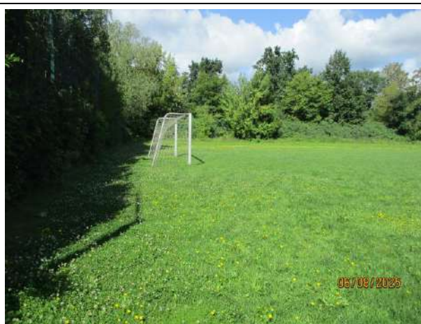
Abb. 2: Blick auf das Sport- und Spielfeld nördlich des Parkplatzes