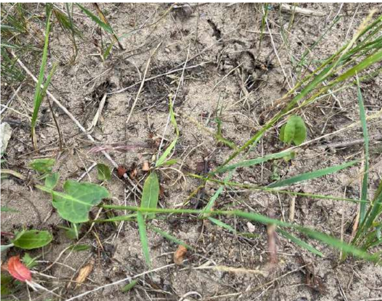
Foto 21 Ameisenbau, 02.06.2025