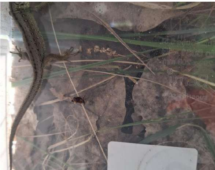
Foto 5 Zauneidechse, subadult, 21.05.2025