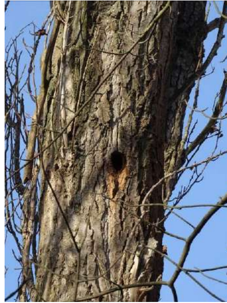
Abbildung 19: Pappel (ID 9), Spechtloch