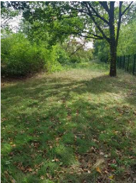
Abbildung 4: Brache zwischen Zaun und gehölzbestandenem Wall (Blick nach Süden)