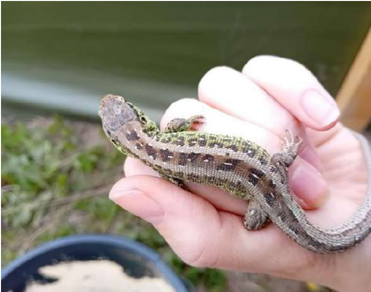
Foto 1 Zauneidechse, männlich, 21.05.2025