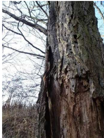
Abbildung 21: Robinie (ID 10), abstehende Rinde