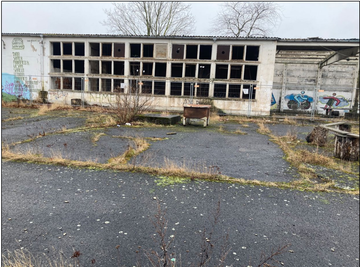
Abbildung 1: Bestandsgebäude (ehemaliges Heizhaus) innerhalb des Planungsraumes

Der Planungsraum befindet sich im Süden des Ortslage Neuhardenberg und umfasst eine zum Teil baulich vorgeprägte und eingezäunte Konversionsfläche. Im westlichen Teil des Geltungsbereiches befindet sich ein Gebäude. Es handelt sich um das ehemalige Heizhaus. Der östliche Teil ist mit sukzessiv aufgewachsenem Gehölzbestand bewachsen.