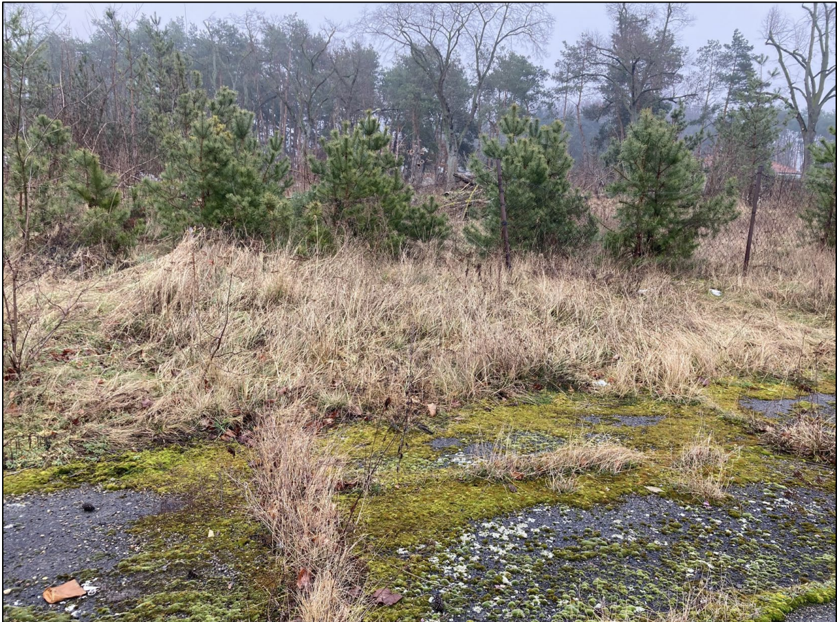
Abbildung 5: Sukzessiver Gehölzaufwuchs im Planungsraum

Innerhalb der geplanten eingeschränkten Gewerbegebietes befinden sich keine Biototypen mit hervorgehobener Bedeutung als Lebensraum für Flora und Fauna.