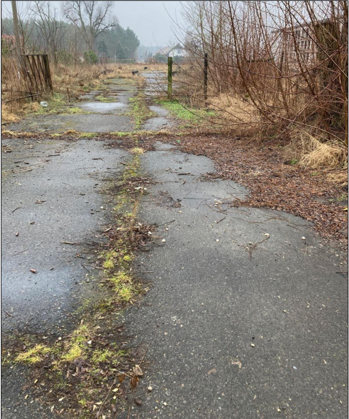
Abbildung 4: Fotografie des Planungsraumes; versiegelte Fläche im Bereich der Zufahrt