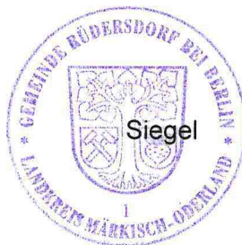
Nico Nolte Bürgermeister