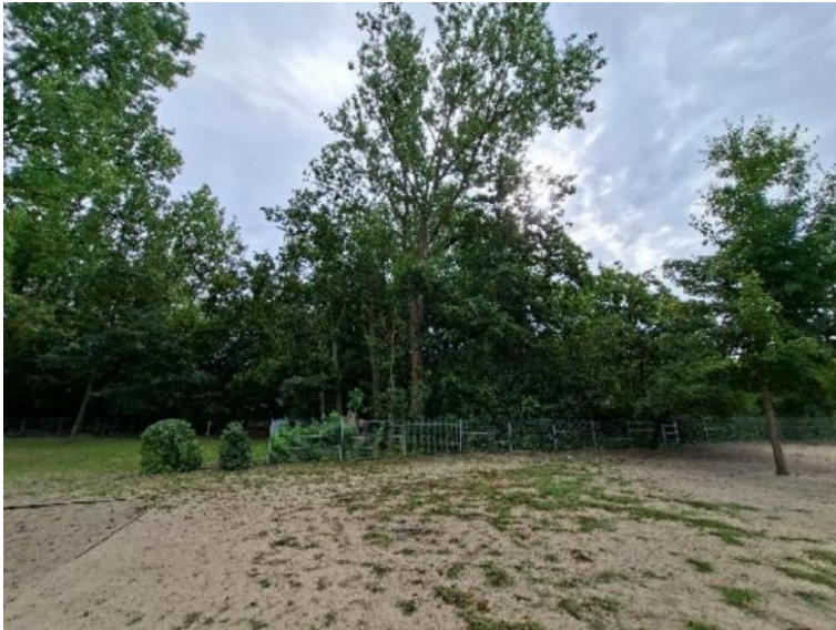
Abb. 14: stark verdichtete Sandfläche mit sporadischer Vegetation auf dem östlichen Schulhofgelände