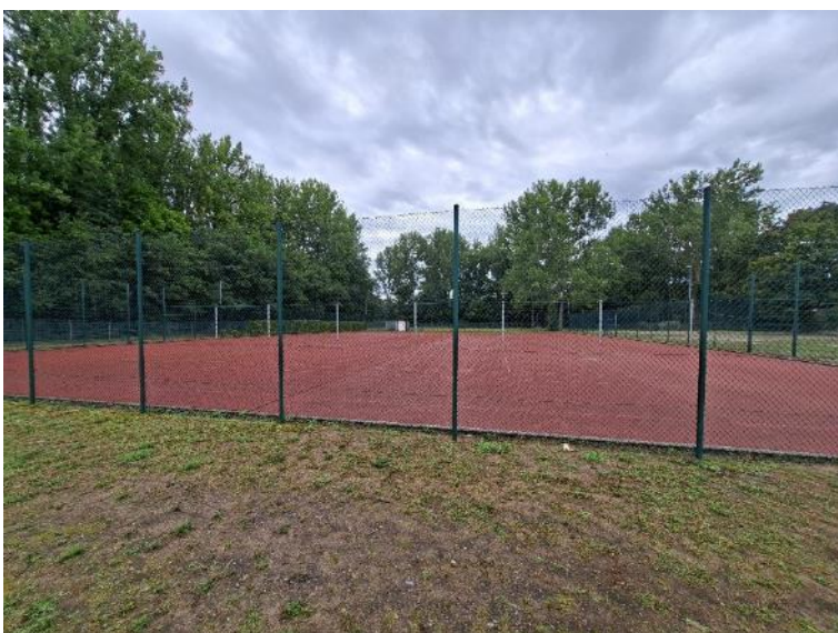
Abb. 9: Tartan- Sportplatz