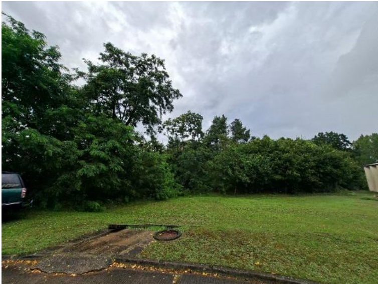
Abb. 11: Scher- rasenfläche im Bereich der Turnhalle