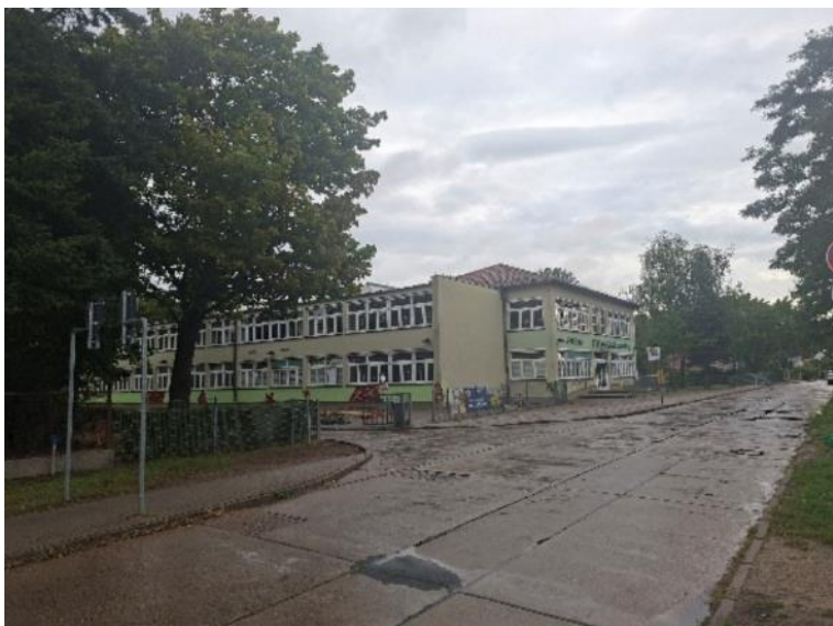
Abb. 2: Fontane-Grundschule; Ansicht von der Goethestraße