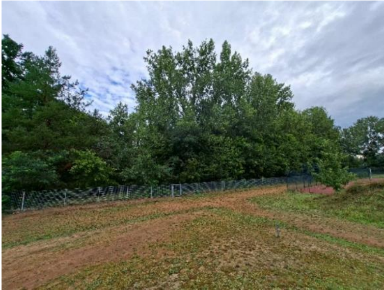
Abb. 13: Rundlaufbahn zwischen Sportplatz und nördlicher Plangebietsgrenze; Lauffläche bereits mit trittresistenten Pflanzenarten bewachsen und als Scherrasen einzuordnen