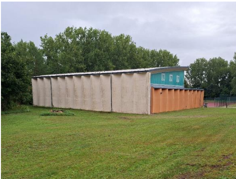
Abb. 8: Sport- halle