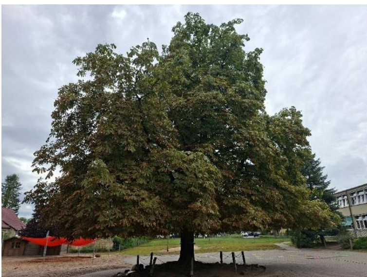
Abb. 12: „Zu- ckertütenbaum“ Kastanie