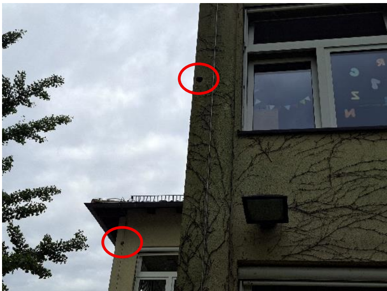
Abb. 4: Spechtlöcher an der östlichen Fassadenseite des Hauptgebäudes