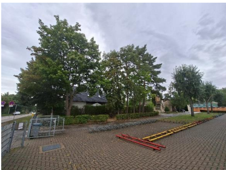
Abb. 6: gepflasterte Grundstücksauffahrt mit Fahrradständer und Baumbestand