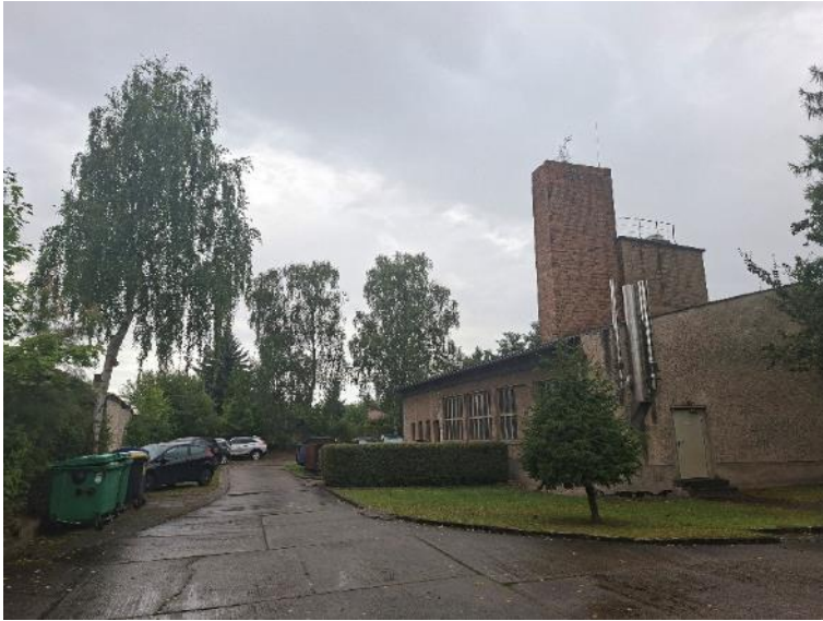
Abb. 7: Heizhaus