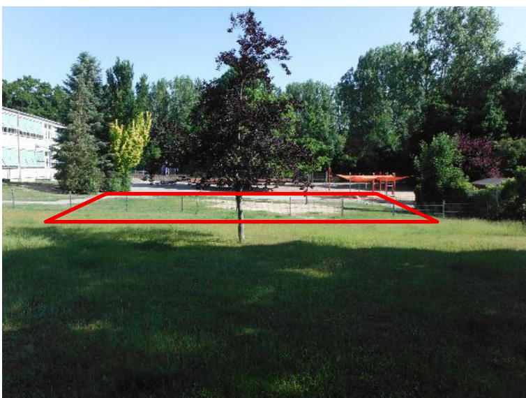
Abb. 15: Vorhabenbereich für den vorgezogenen Neubau Hortgebäude; linker Bildrand das derzeitige Schulhauptgebäude und rechter Bildrand das Wochenendgrundstück