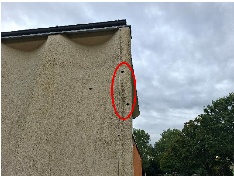
Abb. 5: Spechtlöcher an der westlichen Fassadenseite der Turnhalle