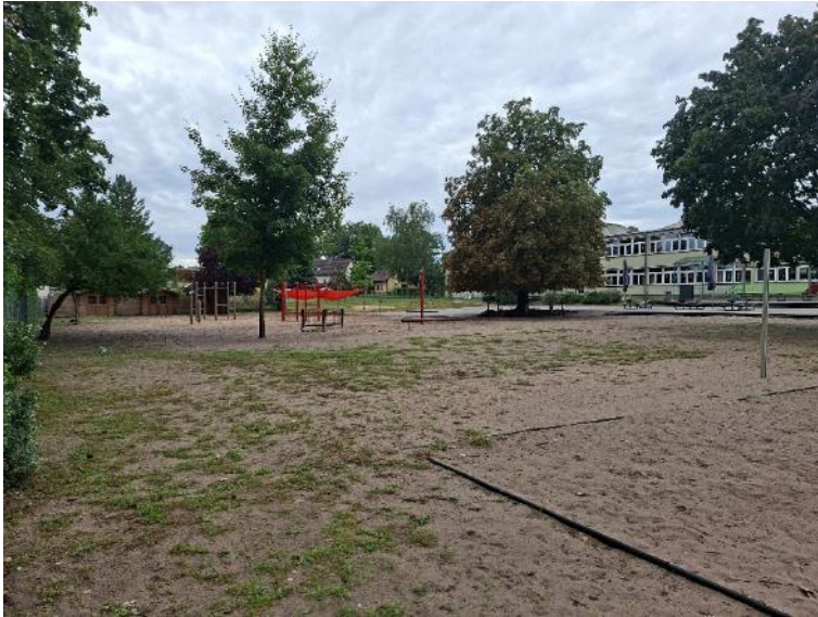
Abb. 10: stark belasteter Schulhofbereich mit Spielgeräten im Osten