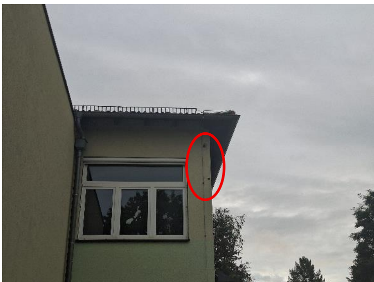
Abb. 3: Spechtlöcher an der westlichen Fasadenseite des Hauptgebäudes