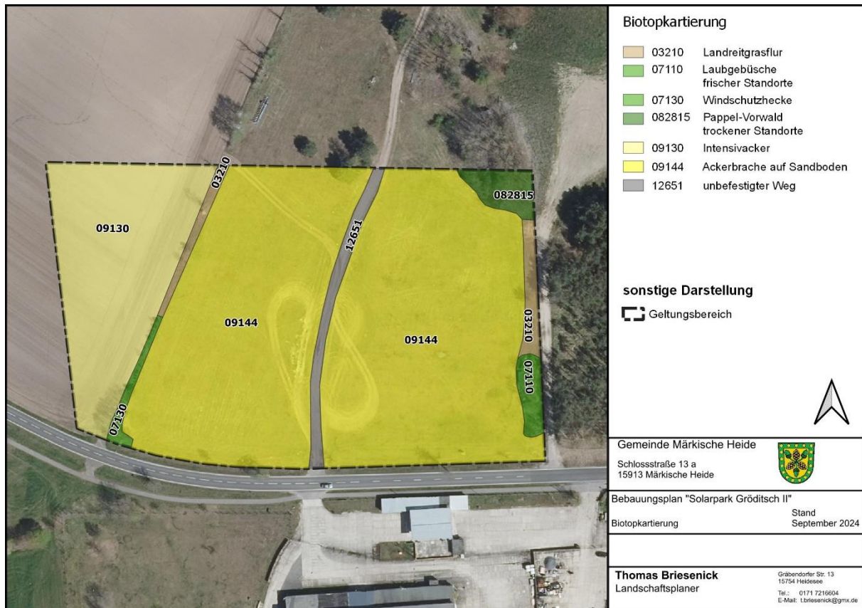
Abb. 2: Geltungsbereiches des Bebauungsplans im Luftbild mit Darstellung der vorkommenden Biotope

Die aufgezählten Pflanzenarten sind weit verbreitet und in keiner Kategorie der Roten Liste Brandenburgs aufgeführt.