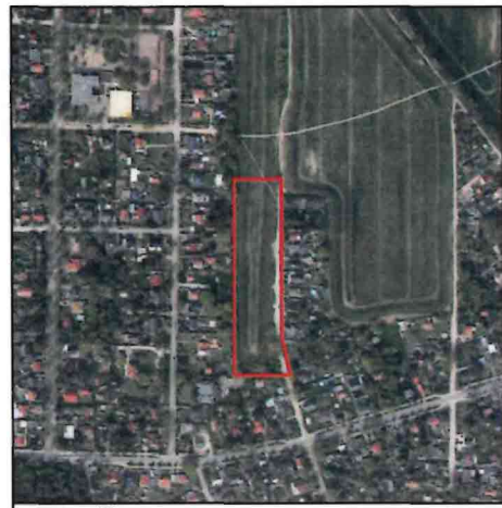
Luftbild (2) M 1:10.000