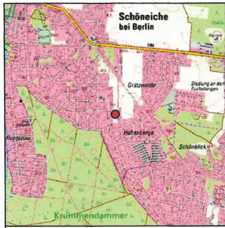
Lage des Teilbereichs (1) M 1:50.000