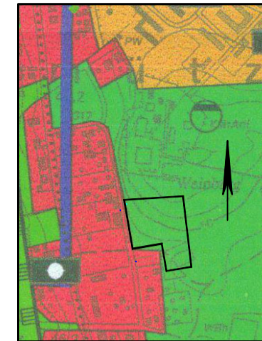
3750 - SW Bad Saarow Pleskow (Stand 1994)