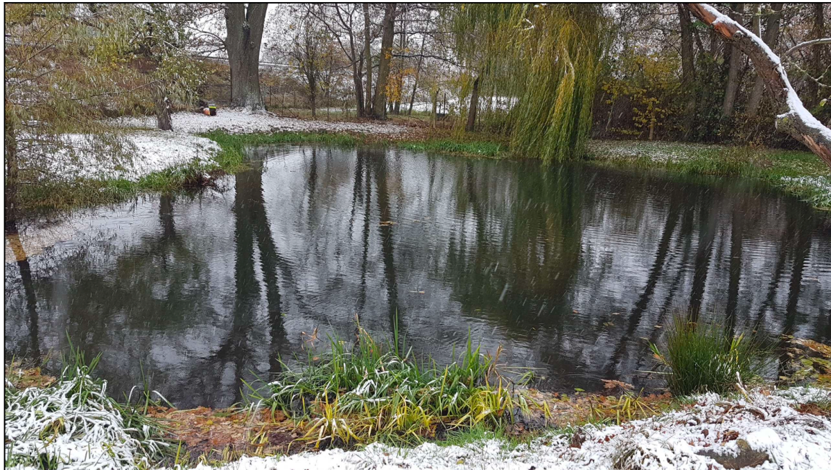
Abbildung 4: Südlicher Teich im November 2024

Das künstlich angelegte Gewässer ist naturnah ausgebildet, bietet verschiedene Tiefenzonen sowie am Rand typische Wasserpflanzen. Durch die nach Westen vorhandenen Bäume besteht eine Teilbeschattung, meist ist das Gewässer jedoch besonnt.