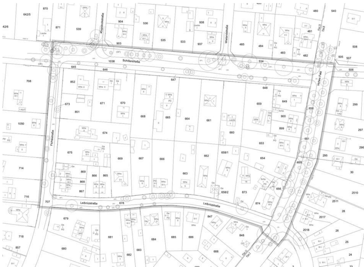
Abb. 1: Übersicht Geltungsbereich (© Öffentlich bestellter Vermessungsingenieur Dipl.-Ing. Joachim Robert)

Das Plangebiet umfasst die Flurstücke; Flur 6, Flurstück 540 teilweise, Flur 7, Flurstück 1 teilweise, Flur 11, Flurstücke: 534 teilweise, 645-648, 649-651, 653-656, 658/1, 658/2, 659-671, 673-675, 678, 707 teilweise, 710 teilweise, 851, 852, 865-869, 873, 874, 899, 900, 1038 teilweise. Die Grundstücke befinden sich in unterschiedlichem Eigentum.