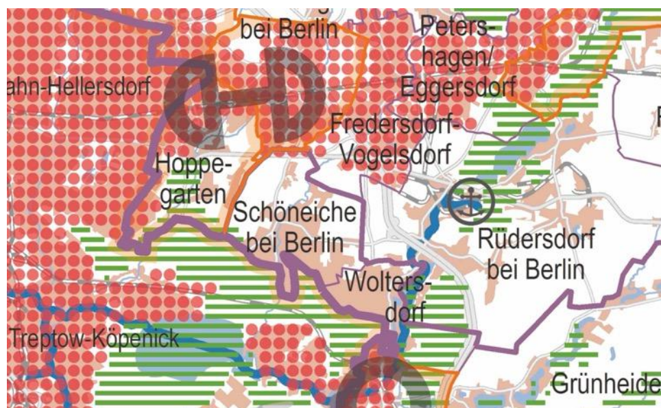
Abb. 2: Ausschnitt Plankarte LEP HR 2019

→ Vorhandener Freiraum wird in die Planung nicht einbezogen. Die geplante zusätzliche Flächeninanspruchnahme soll gering gehalten werden. Schutzgebiete werden nicht in die Planung einbezogen.