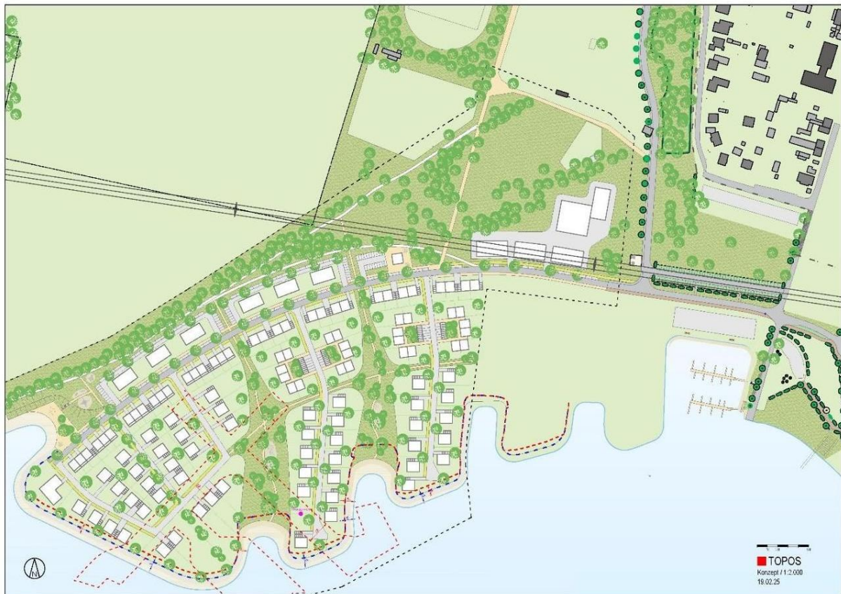
Abb.: Masterplan Sedlitzer Bucht

Die Erschließung erfolgt durch die nördlich verlaufende Haupterschließung, von der 4 Wohnstraßen in das Quartier führen. Die erkennbaren Einbuchtungen werden ausgeprägt durch öffentliche Grünflächen, die die Quartiersbereiche zudem über Wegeführungen miteinander verbinden. Entlang der Uferböschung des Sedlitzer Sees ist ein Gewässerrandstreifen vorzuhalten und nach den Vorgaben des zuständigen Gewässerunterhaltungsverbands zu entwickeln (z. B. Wirtschaftsweg). Am nordöstlichen Eingang des Quartiers befindet sich ein öffentlicher Parkplatz für Bewohnende und Besuchende. Nordwestlich mündet das Quartier in einen öffentlichen Quartiersplatz.