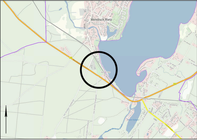
Übersichtsplan zum FNP Maßstab 1:25.000 Plangrundlage: Brandenburgviewer, 19.7.2023

0 100 200 500 Maßstab (im Original A3) 1:10.000