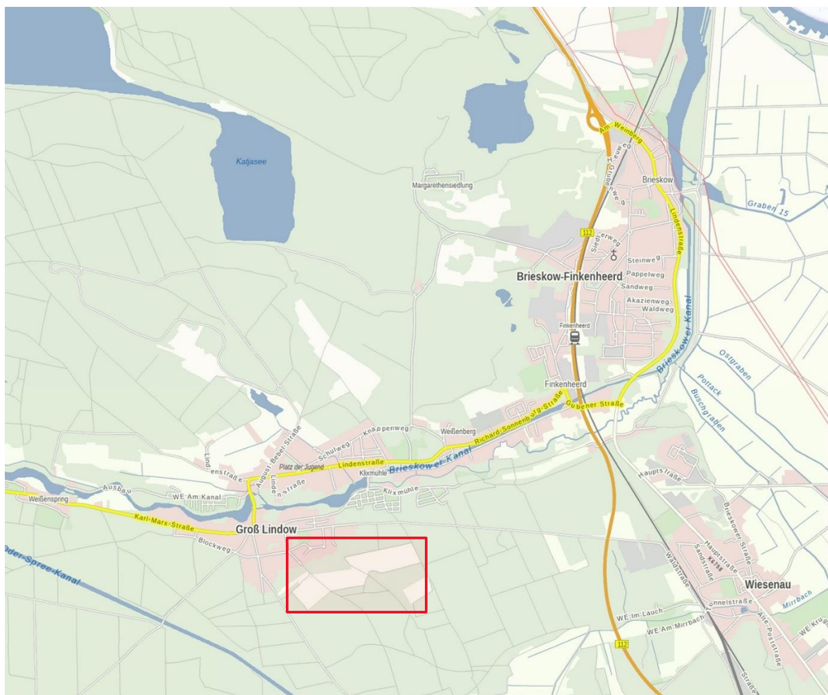
Abbildung 1: Lage des Änderungsbereichs (nicht maßstäblich)

Da der VBP mit der Festsetzung eines sonstigen Sondergebiets mit der Zweckbestimmung für die Nutzung erneuerbarer Energien als Photovoltaik-Freiflächenanlage (SO Photovoltaik) nicht aus dem FNP entwickelt ist und diese Fläche den Schwellenwert von 1 ha überschreitet, wird parallel das Verfahren zur 3. Änderung des FNP gemäß § 8 Abs. 3 BauGB durchgeführt. Die Änderung erfolgt für den Geltungsbereich des VBP mit einer Fläche von 15,6 Hektar.