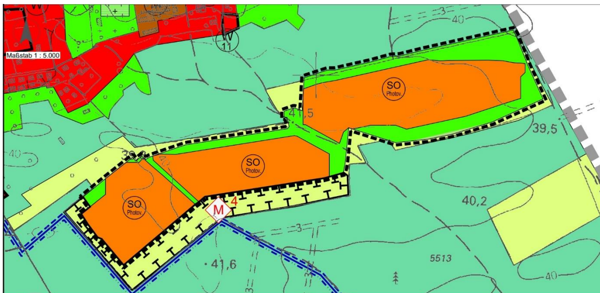
Abbildung 3: Bereich der 3. Änderung des Flächennutzungsplanes Groß Lindow (unmaßstäblich)

Entsprechend der geplanten Nutzung als Photovoltaik-Freiflächenanlage wird die Art der Nutzung als Sonderbaufläche Photovoltaik dargestellt. Im Änderungsbereich wird die bisherig dargestellte „Fläche für die Landwirtschaft“ aufgehoben. Die Flächen für Maßnahmen zur Pflege und Entwicklung der Landschaft (M4 Waldrandgestaltung), die im Süden und Westen an das Sondergebiet angrenzen, bleiben bestehen.