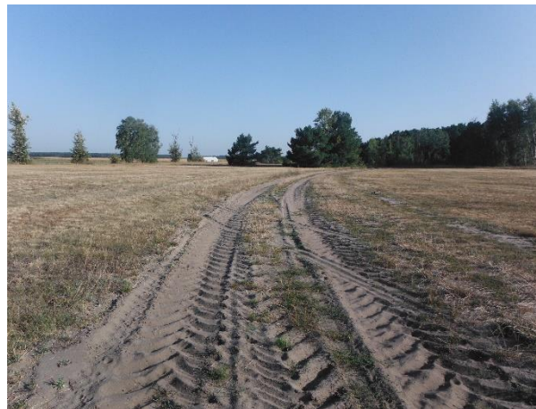
Abb. 10: Wirtschaftsweg