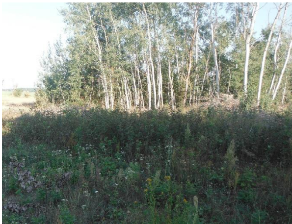
Abb. 9: Pappelvorwald