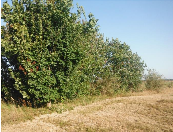
Abb. 5: Fragment der Windschutzhecke