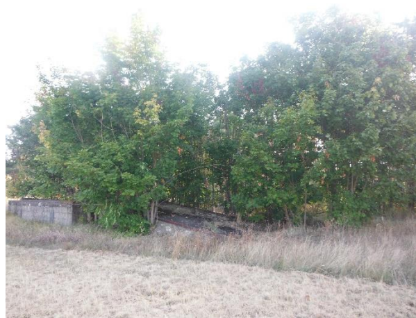
Abb. 8: Laubgebüsch mit Verladerampe