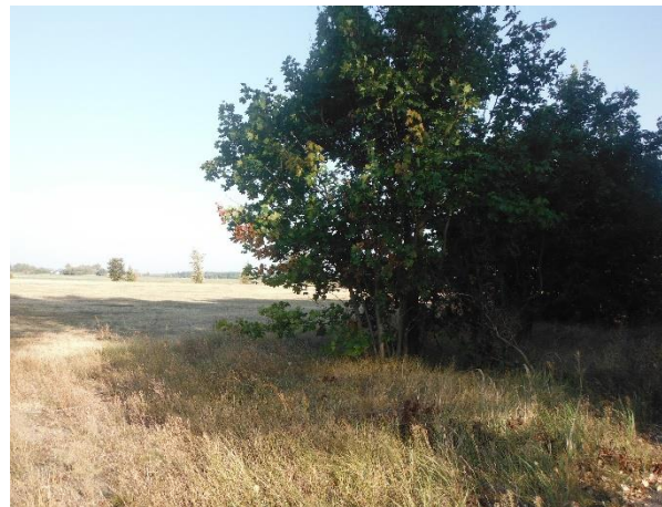
Abb. 4: Landreitgrasflur mit dahinter befindlichem Intensivacker