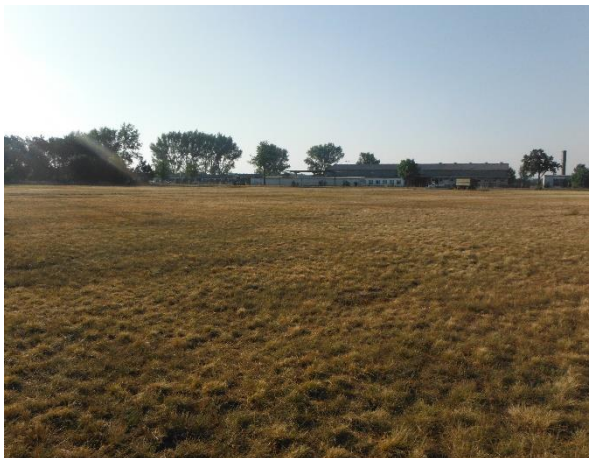
Abb. 3: Ackerbrache (Plangebiet); Blickrichtung Straße B 179