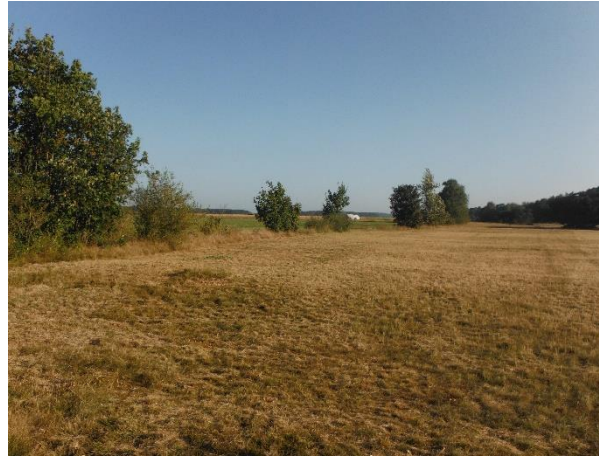
Abb. 6: weiterer Verlauf der stark lückigen Windschutzhecke in Richtung Norden