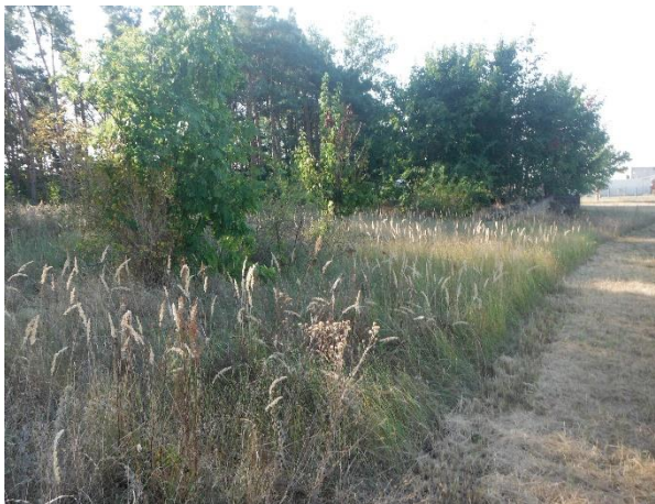
Abb. 7: Landreitgrasflur an der östlichen Plangebietsgrenze