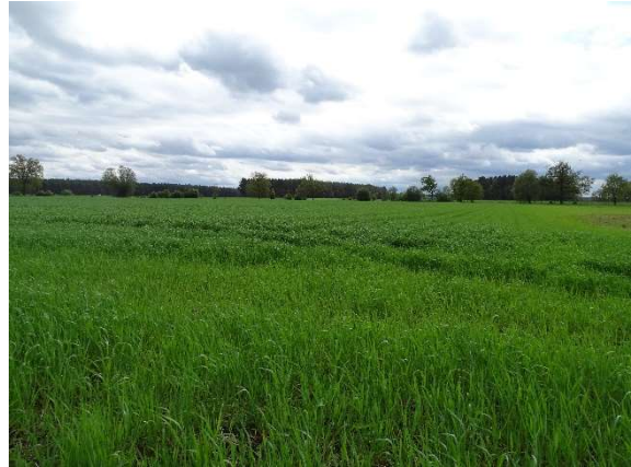
Foto 2: Blick von Feldweg nach Süden mit Gehölzen entlang der Südgrenze des B-Planes