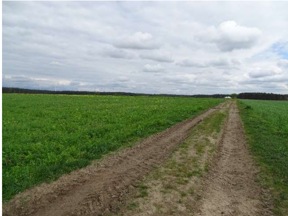
Foto 1: Blick vom Osten auf die südwestlichen Ackerflächen, Feldweg im südlichen Bereich des Plangebiets