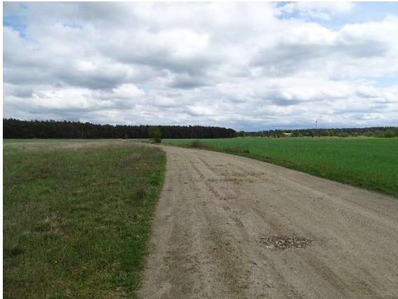
Foto 3: Nördlicher Feldweg im Plangebiet mit nördlichen Ackerflächen und alten Schäferei im Hintergrund