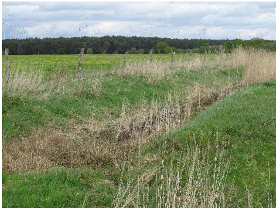
Foto 5: Missen-Tornitzer Graben entlang der östlichen Plan- gebietsgrenze