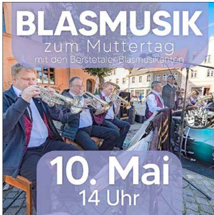
Grafik: Fred Bauer