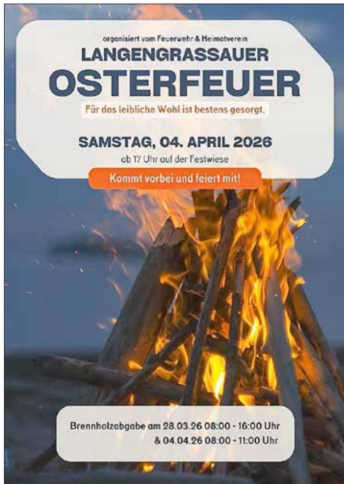
Grafik: Feuerwehr- und Heimatverein Langengrassau