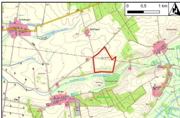
Abbildung 1 Lageabgrenzung zum vorhabenbezogenen Bebauungsplan Nr. 3 „Solarpark Görike - Gehren“ auf Grundlage der Digitalen Topografischen Karte 1:25.000, unmaßstäblich