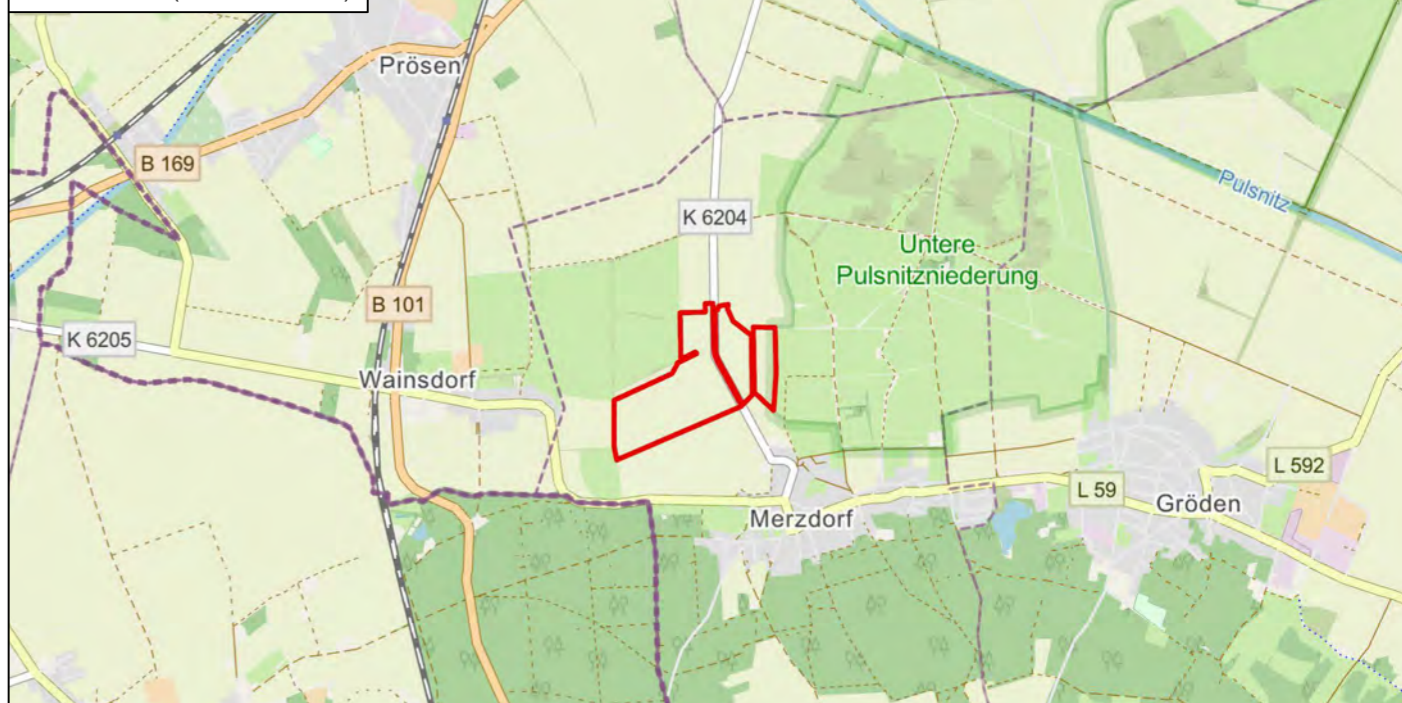
Übersichtskarte (Maßstab 1:50000)