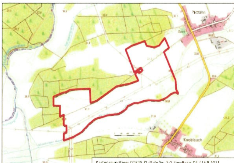
Topografische Karte mit Darstellung Geltungsbereich (rot). unmaßstablich