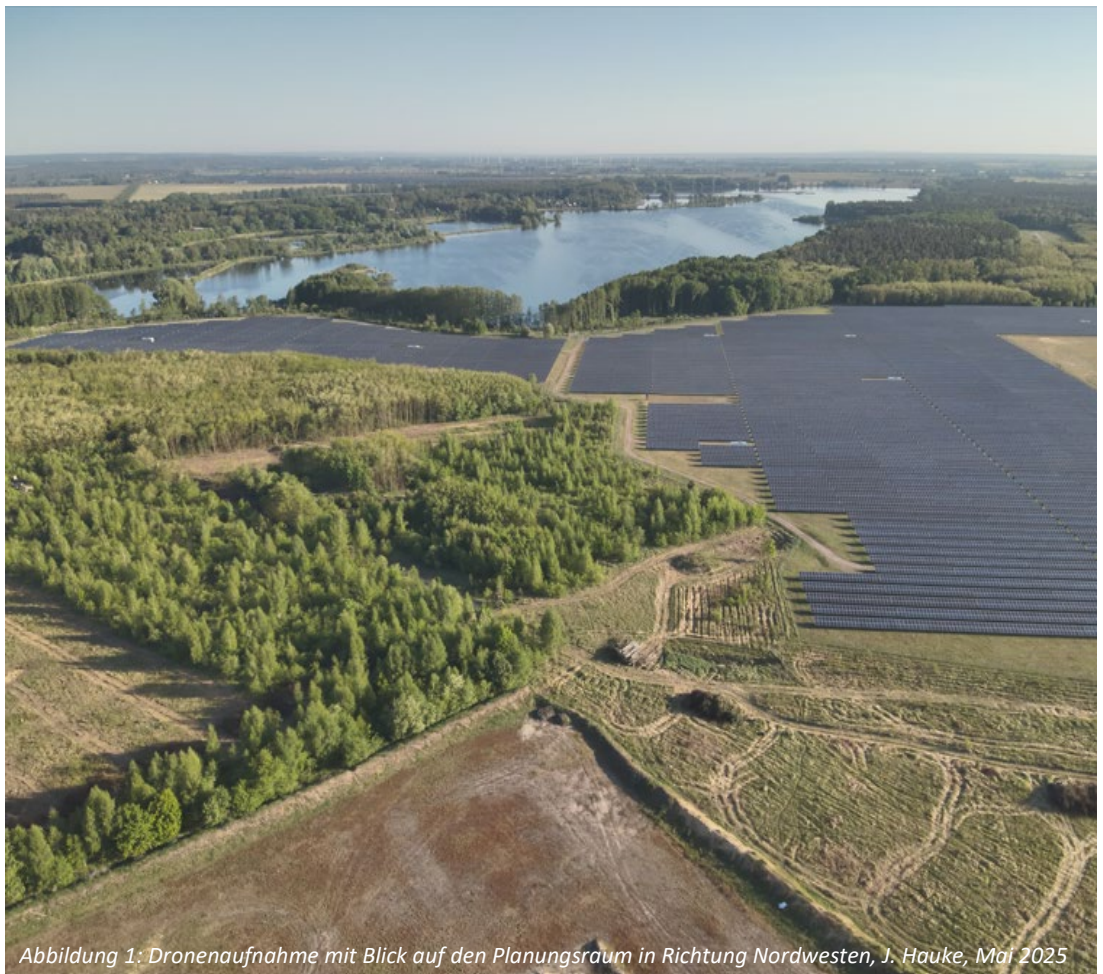
Abbildung 1: Dronenaufnahme mit Blick auf den Planungsraum in Richtung Nordwesten, J. Hauke, Mai 2025