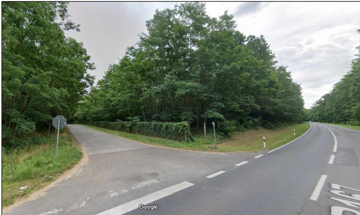
Abbildung 6: Blick auf den Knotenpunkt B 167/Hauptzufahrt in den Geltungsbereich

Die Erforderlichkeit eines Ausbaus dieses Knotenpunktes wird in Abhängigkeit des zu erarbeitenden Verkehrsgutachtens in enger Absprache mit dem Landesbetrieb für Straßenwesen als zuständiger Baulastträger der Bundesstraße in weiteren Planungsphasen festgelegt.