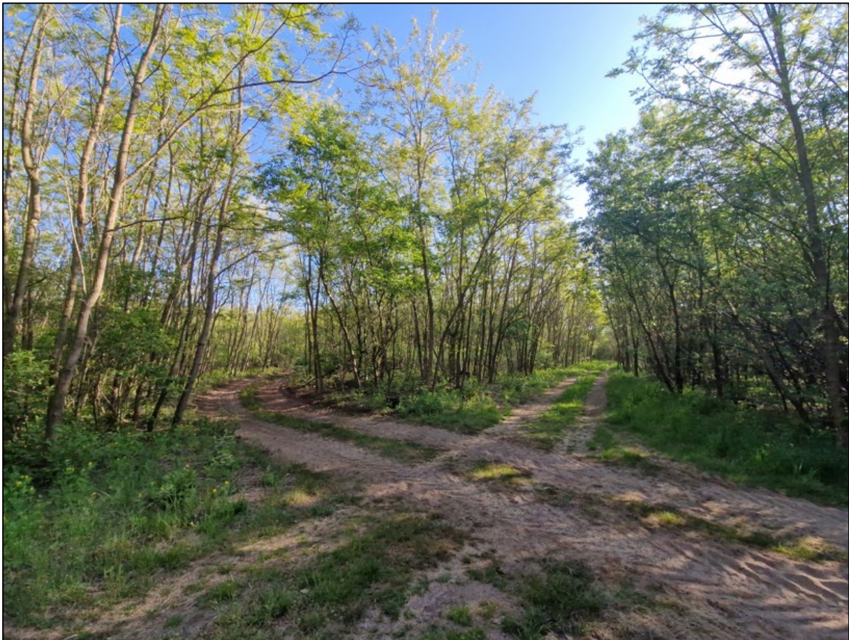
Abbildung 2: Robinienbestand im Westteil des Planungsraumes, J. Hauke, Mai 2025

Westlich und entlang der Bundesstraße herrscht die Mischbaumart Robinie mit schwachem bis mittlerem Baumholz vor (Biotopcode 086880006). Mischbaumarten können sich hier aufgrund des hohen Entwicklungsdrucks der Robinie als invasive Art nicht durchsetzen.