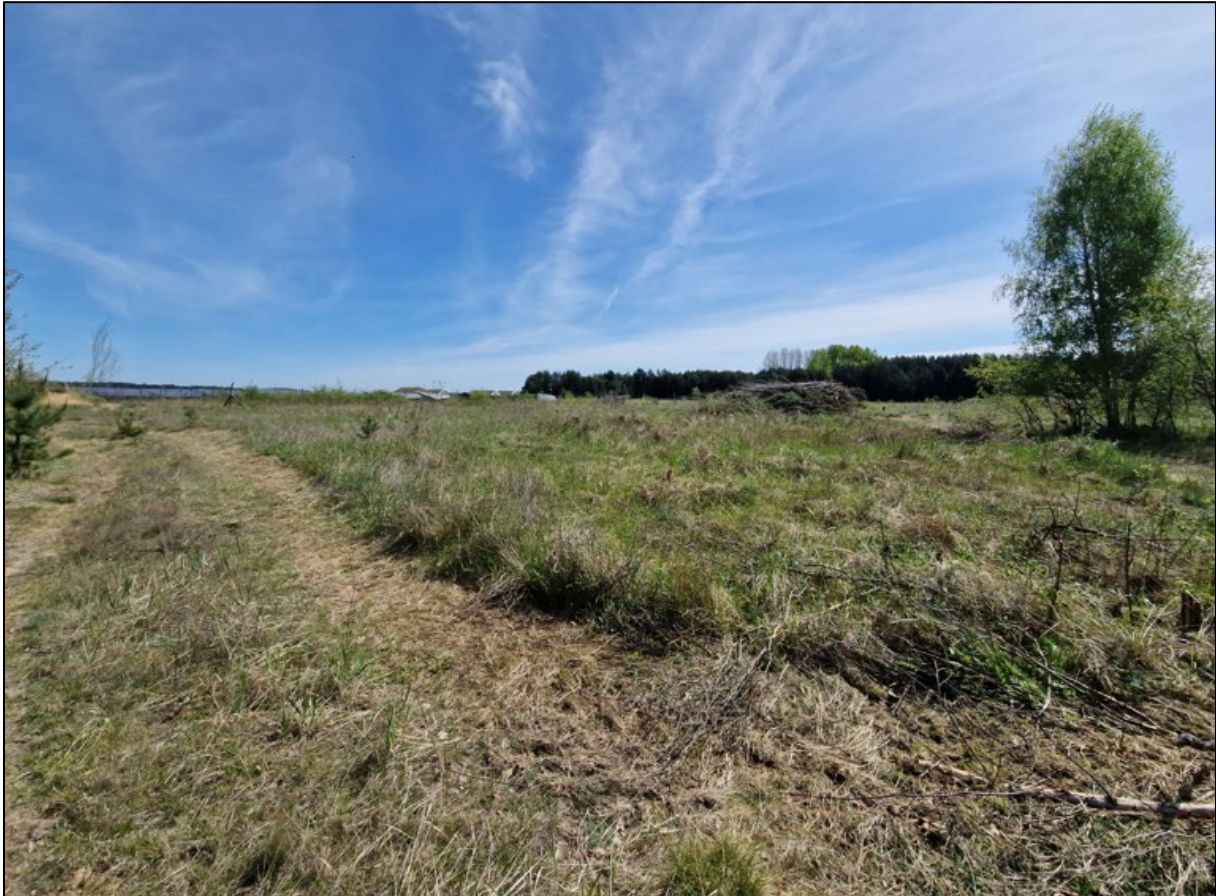
Abbildung 3: Offenlandstrukturen im Nordosten des Geltungsbereiches

Der östliche Teil des Planungsraumes wird durch offene oder halboffene Ruderalfluren bestimmt. Die Krautschicht wird aufgrund der verarmten Bodenverhältnisse von Reitgras beherrscht.