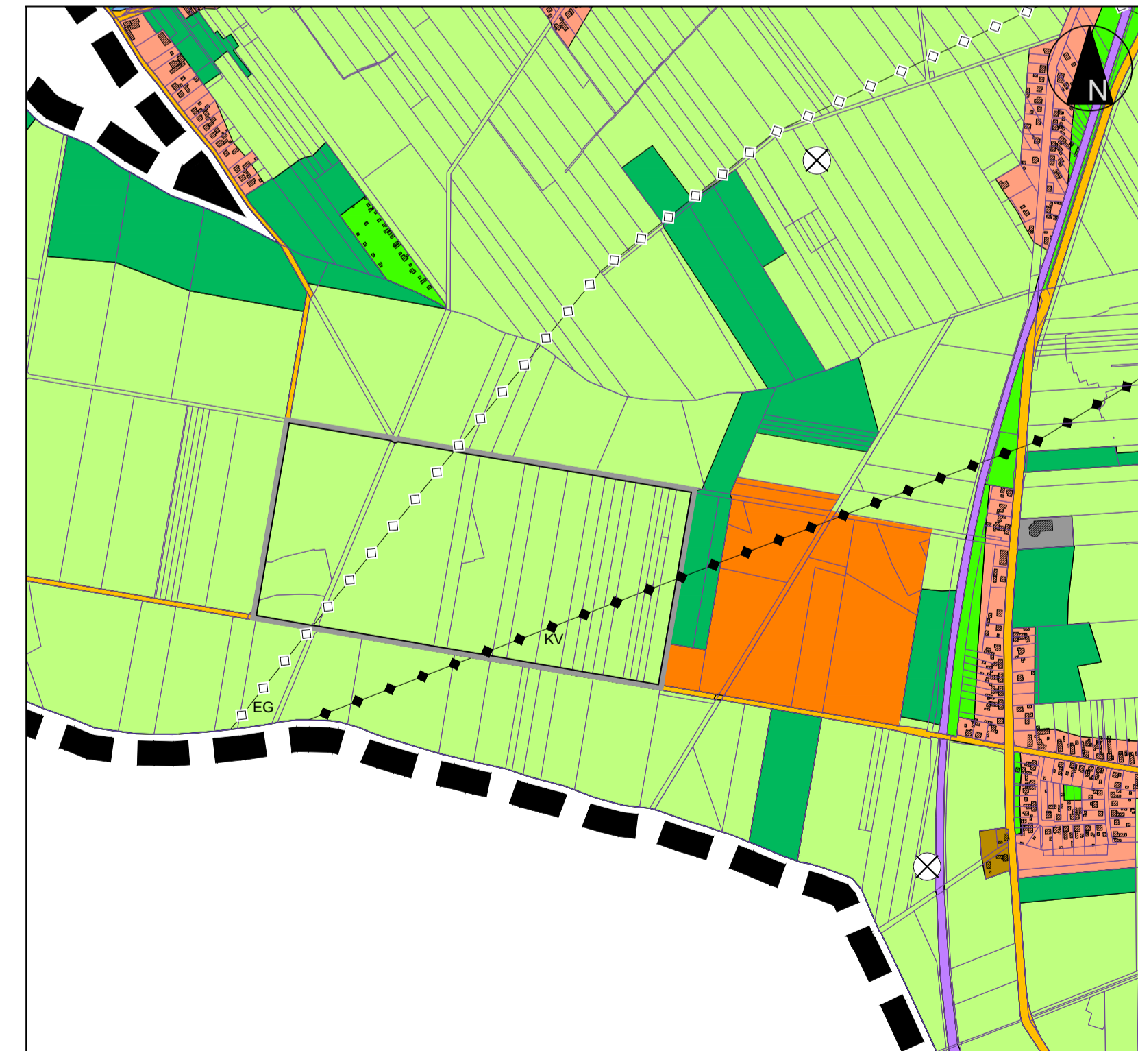
(Darstellung des Flächennutzungsplans vom 20.11.2018)