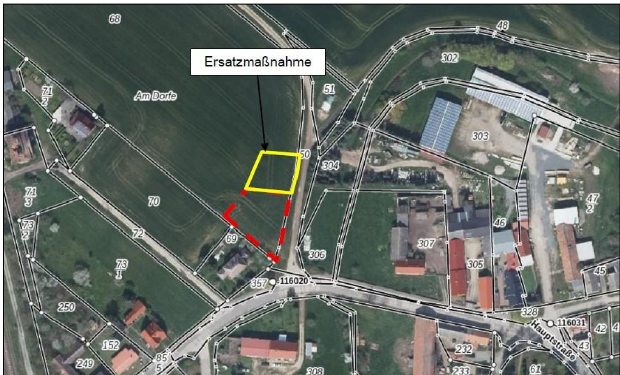
Abbildung 2: Lage der Ersatzmaßnahmenfläche

Quelle: https://bb-viewer.geobasis-bb.de/ (ohne Maßstab)