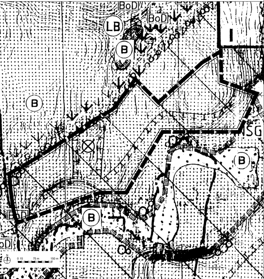
Farbliche Darstellung des Geltungsbereichs - Amtsflächennutzungsplan Lübbenow 1 Landkreis Uckermark - Wirksame Fassung Stand 15.06.2000