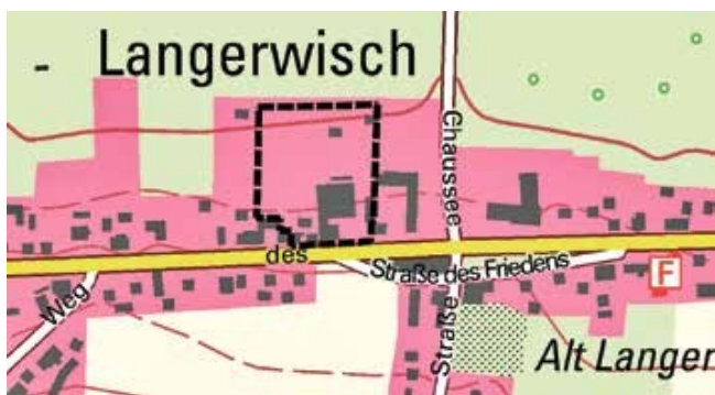
Abbildung: Lage und Abgrenzung des Änderungsbereichs des Flächennutzungsplans (umrandete Fläche)

Die Lage und Abgrenzung der Plangebiete ist in den nachstehenden Kartenausschnitten (Abbildung ohne Maßstab) dargestellt.