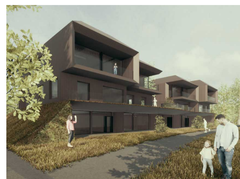
Typ 04 Waldhäuser B EG+1.OG+2.OG+Galerie 4 - 6 Gäste