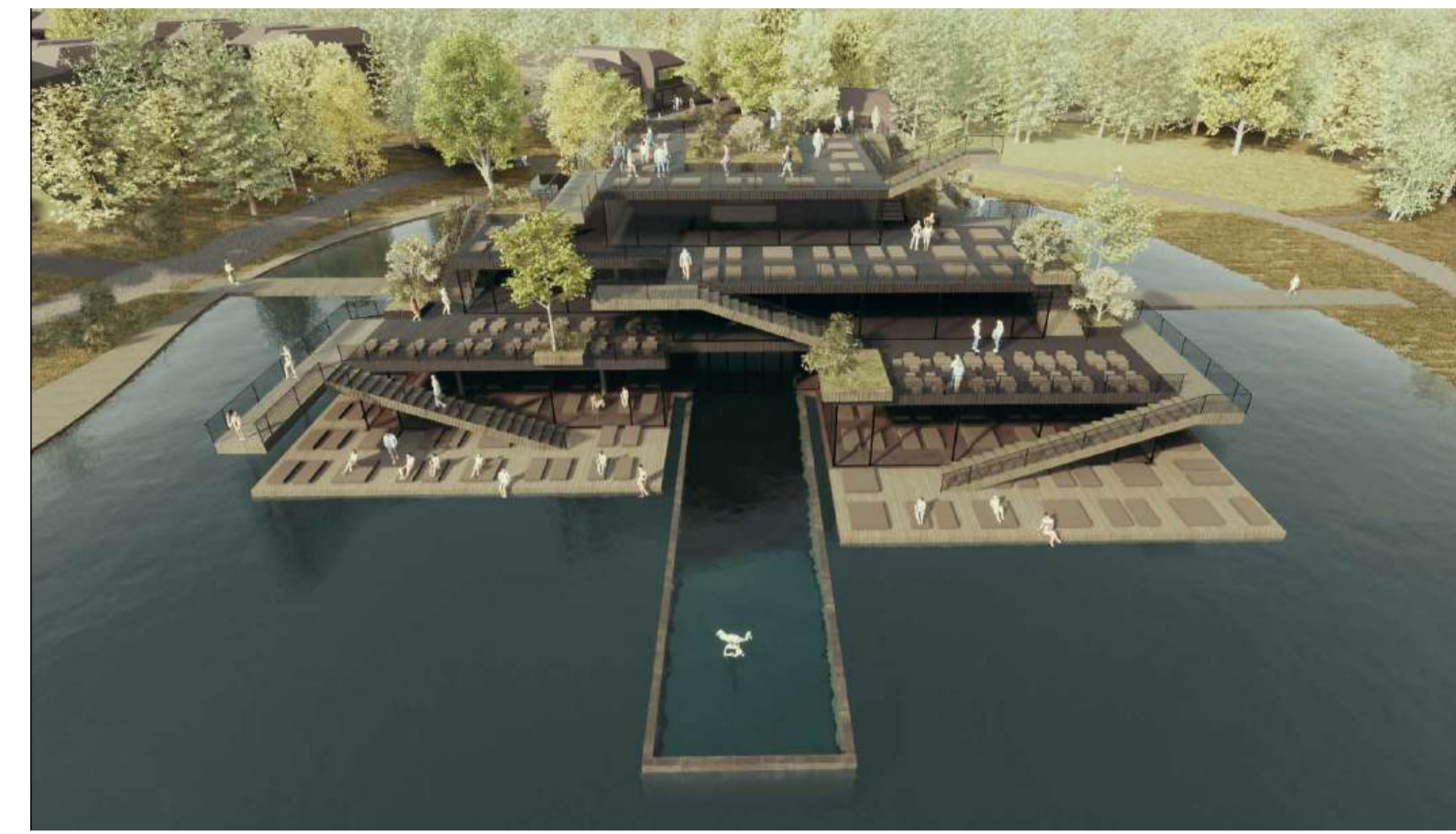
Öffentlicher Bereich - Insel Restaurant, Spa, Naturpool Visualisierung