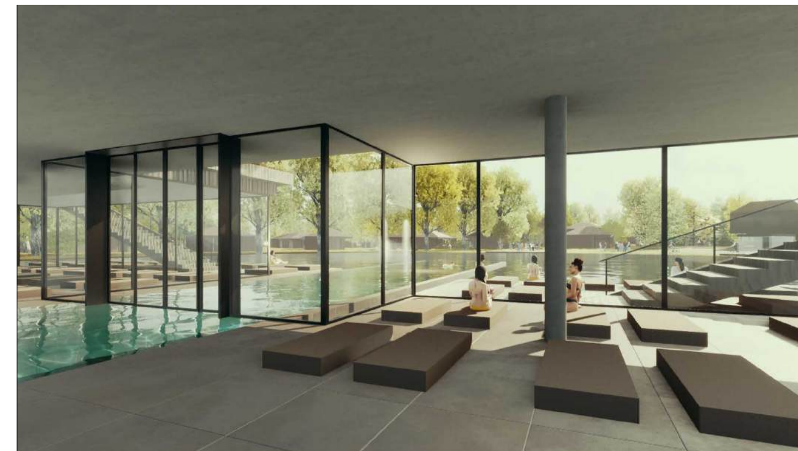
Öffentlicher Bereich - Insel Poolbereich Visualisierung