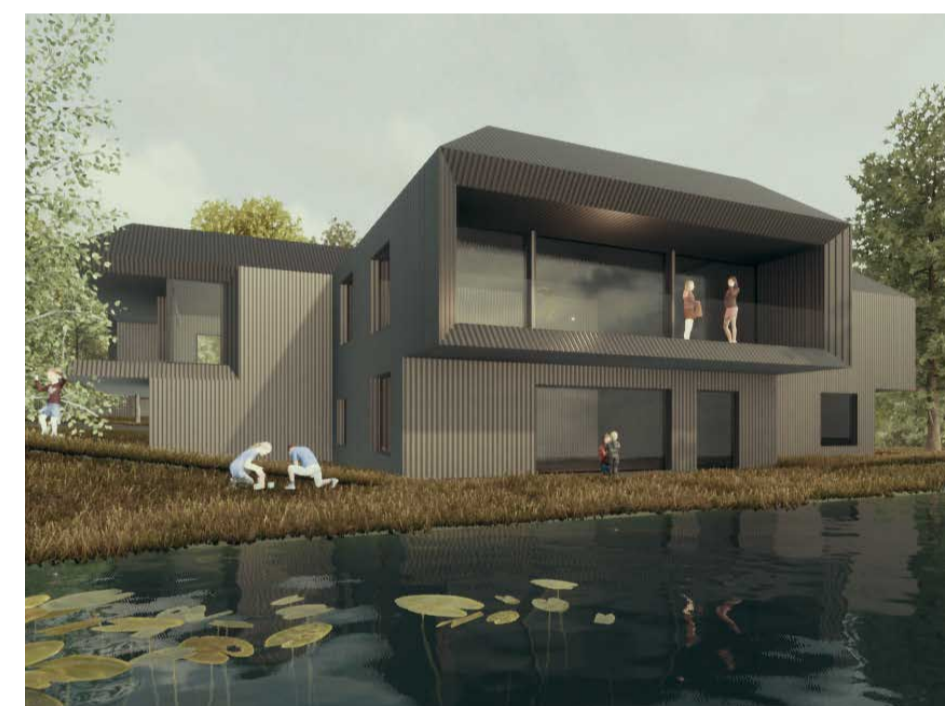
Typ 03 Viererhäuser EG+1. OG+Galerie 5 Gäste