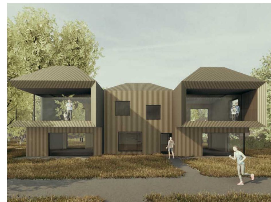
Typ 02 Dreierhäuser EG+1.OG+Galerie 2 - 4 Gäste