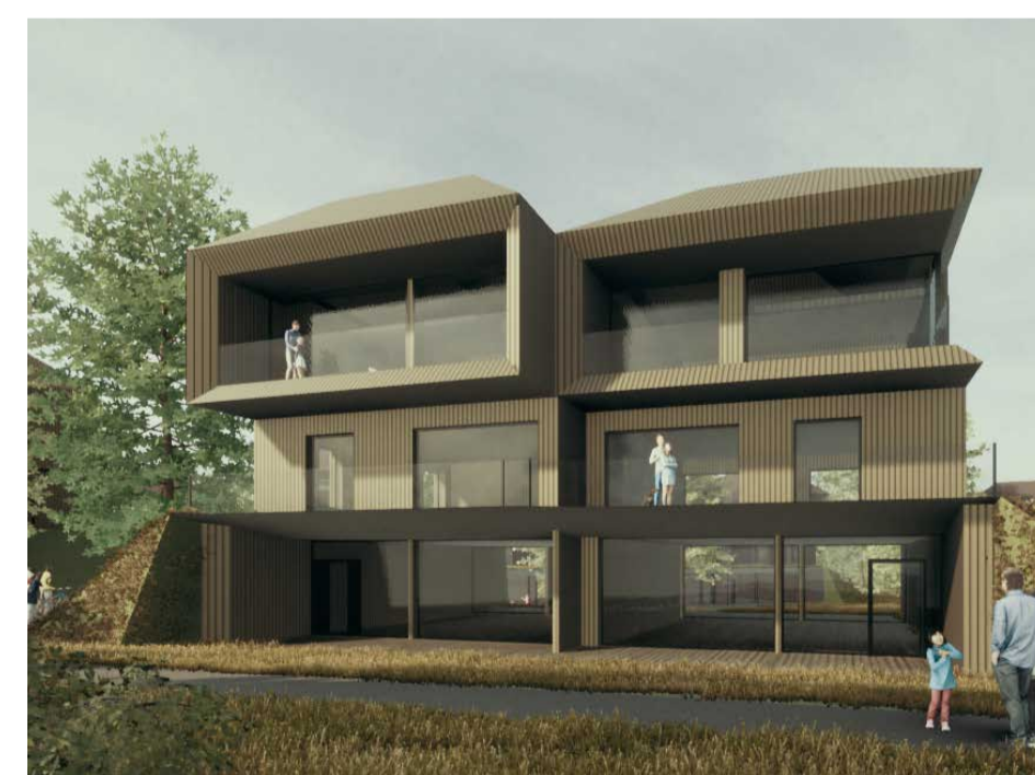
Typ 04 Waldhäuser A EG+1.OG+2.OG+Galerie 4 - 6 Gäste