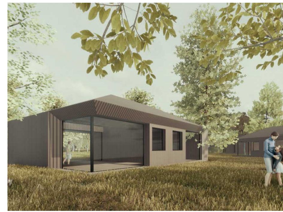
Typ 01 Ferienhäuser EG+Galerie 2 - 4 Gäste