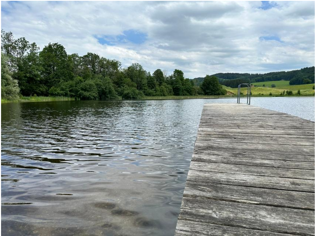
Bild 3. Strandbereich mit Flachwasserzone und Kneipbecken im Hintergrund