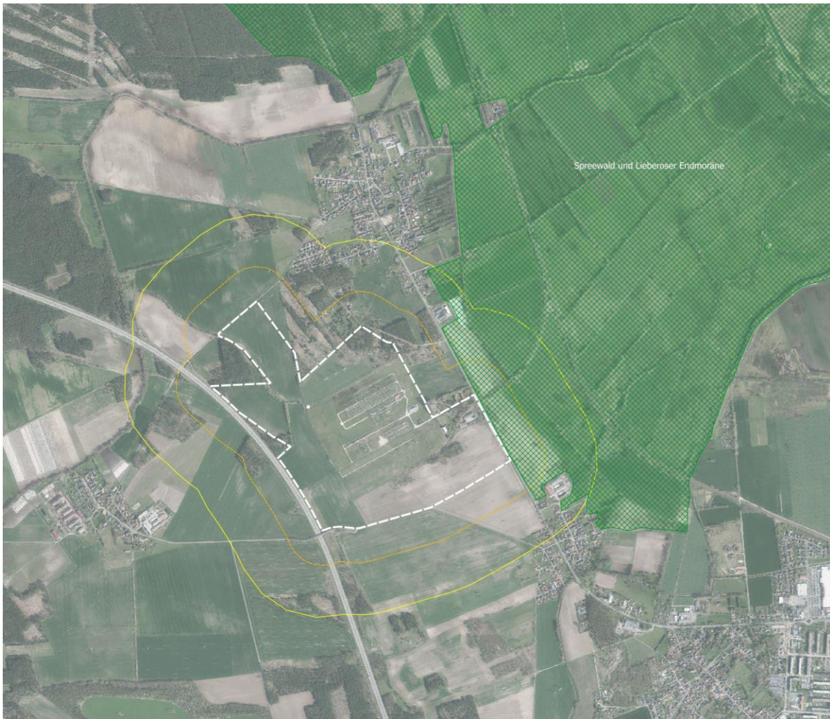
Abb. 3: schematische Reichweite der Wirkfaktoren um das geplante Vorhaben (orange: 200 m; gelb: 500 m)