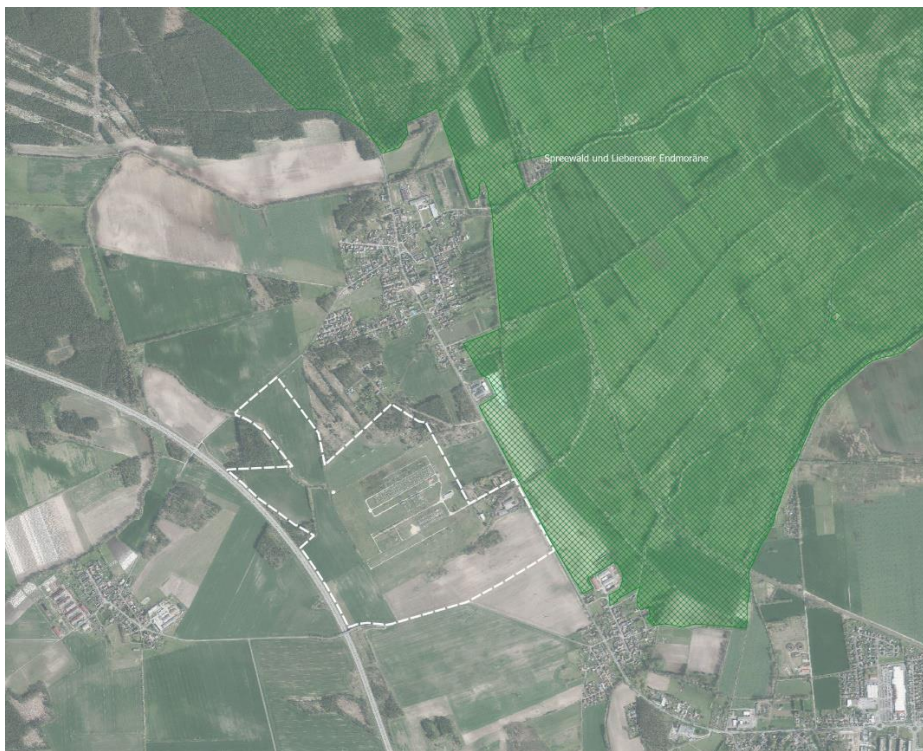
Abb. 1: Lage des Vorhabengebietes zum NATURA-2000-Gebiet (hier SPA-Gebiet; grün); (Quelle: Geoportal Brandenburg)

Aufgrund der Lage des SPA-Gebietes können Beeinträchtigungen nicht offensichtlich ausgeschlossen werden und es ist eine vertiefende Prüfung durchzuführen.