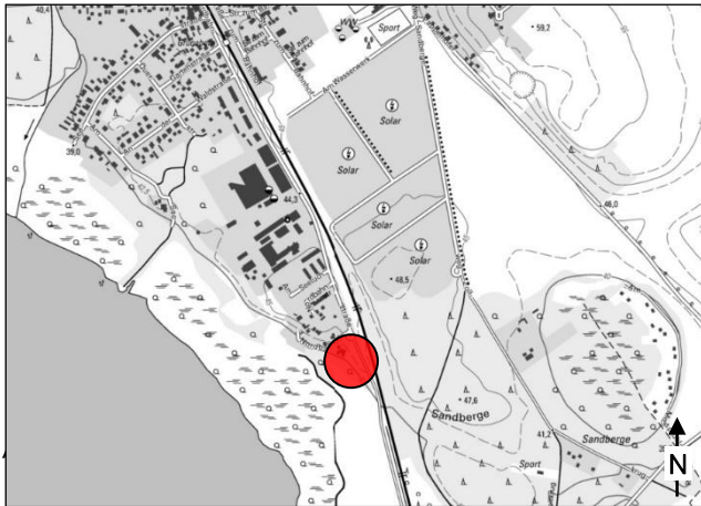
Lage im Ortsbild