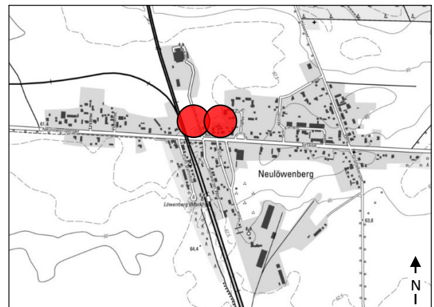
Lage im Stadtgebiet