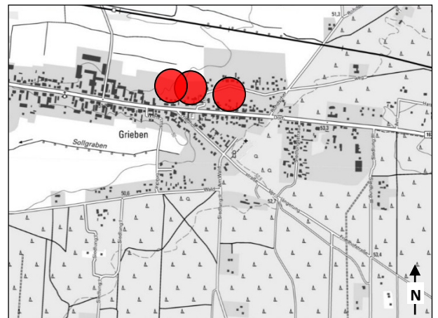
Lage im Stadtgebiet