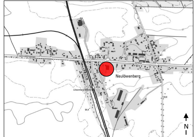
Lage im Stadtgebiet

siehe „Allgemeiner Umweltbericht“ (Kapitel B)