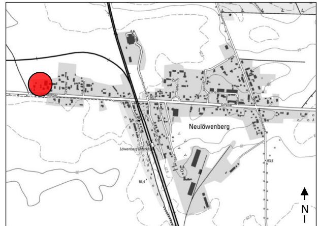
Lage im Stadtgebiet