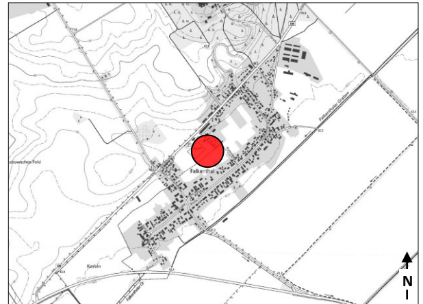
Lage im Stadtgebiet

siehe „Allgemeiner Umweltbericht“ (Kapitel B)